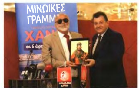
Εικόνα του Αγίου Νικολάου προστάτη των Ναυτικών πρόσφερε στην εταιρεία ο υπουργός κ. Κουρουμπλής .

Το Cruise Ferry MYKONOS ΠΑΛΑΣ θα εκτελεί τα προγραμματισμένα δρομολόγια του, σε 6 ώρες και 30 λεπτά, με καθημερινές αναχωρήσεις, από το λιμάνι του Πειραιά στις 16:00 και από το λιμάνι της Σούδας στις 24:00.