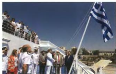
Η γαλανόλευκη σημαία κυματίζει πλέον στο πλοίο Cruise Ferry MYKONOS PALACE

Cruise Ferry MYKONOS PALACE , ένα νέο πλοίο μόλις 16 ετών, ενισχύοντας την περαιτέρω τουριστική και οικονομική ανάπτυξη της ευρύτερης περιοχής.