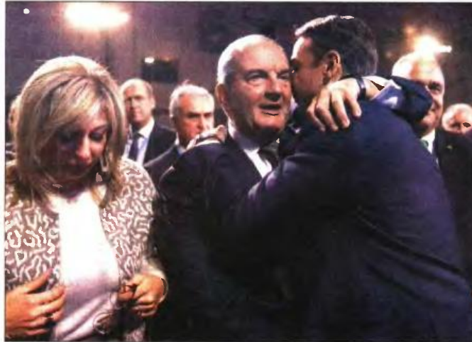
Ο Κυριάκος Μητσοτάκης χαιρετά τον Κώστα Καραμανλή στο Συνέδριο της Ν.Δ.

Επί του προσωπικού, για όσα αξία έχουν αυτά στην πολιτική, ο Κυριάκος μίλησε περισσότερο από όσο έπρεπε στην πρωτολογία του, η ομιλία του ήταν « καστρωλόγος » και ύστερα από ένα σημείο κούρασε . Αντιθέτως, πήγε πολύ καλύτερα στα θεματικά πάνελ και μάλιστα χωρίς γραπτό κείμενο . Υπερβολικό και το μακιγιάζ που έγινε για τις ανάγκες της τηλεοπτικής κάλυψης: Σκλήρυνε πολύ το πρόσωπό του. Πέραν αυτών, το συνέδριο