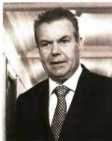
Τάσος Πετρόπουλος, υφυπουργός Εργασίας.