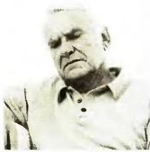
υπερέβαιναν τα 1.400 ευρώ. Παρακαλώ τα φώτα σας. Σας ευχαριστώ, Παν. Πετρ.

Κατ' αρχάς θέλω να σας ευχαριστήσω για την πλήρη και ταχεία ενημέρωση που μας παρέχετε σε ό,τι αφορά τα συνταξιοδοτικά θέματα που μας απασχολούν. Θέλω να υποβάλω αίτηση για την επιστροφή των κρατήσεων υπέρ ΕΑΣ. Στην ηλεκτρονική αίτηση προς τον ΕΦΚΑ που αφορά στη μη εφαρμογή των μειώσεων των ν. 4051 και 4093, προσθέτω και τη μη εφαρμογή της ΕΑΣ αλλά το εύρος του χώρου που παρέχεται στο σημείο Β της αίτησης δεν το επιτρέπει. Μπορώ να κάνω έντυπη αίτηση ειδικά για την ΕΑΣ; Και τι κατά τη γνώμη σας πρέπει να γράψω; Είμαι συνταξιούχος του ΙΚΑ από το 2010 και οι αποδοχές μου