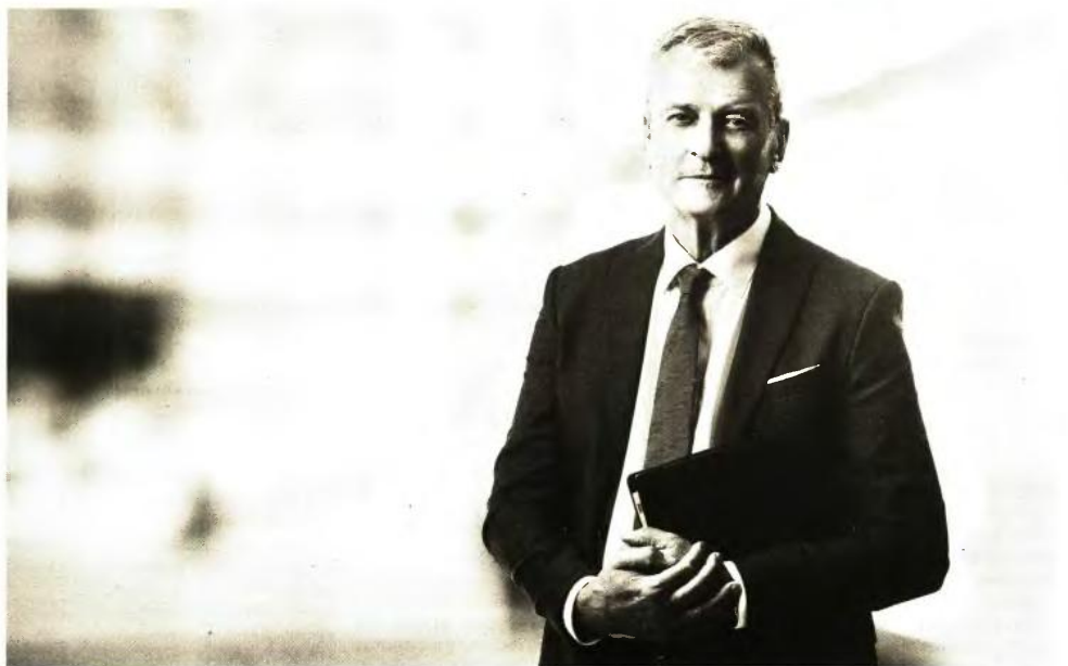
Τα αναδρομικά που επιστρέφονται από τις αντισυνταγματικές μειώσεις ν. 4051 και ν. 4093

Συνταξιούχος ΝΑΤ με κύρια σύνταξη 1.293 ευρώ και επικουρική 250 ευρώ, με αναδρομικά για 42 μήνες από τις παράνομες μειώσεις, παίρνει 17.400 ευρώ προ φόρου, ενώ με τους 12 μήνες (σχέδιο κυβέρνησης) θα πάρει 5.640 ευρώ. ■