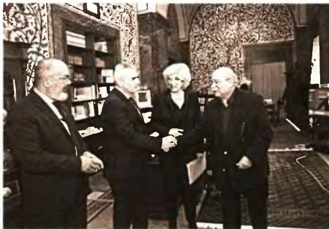
Από αριστερά οι Κωνσταντίνος Μπαργιώτας, Μάξιμος Χαρακόπουλος, Αθηνασία Αναγνωστοπούλου και Νικόλαος Βούτσης

Ο πρόεδρος της Βουλής ευχαρίστησε τα μέλη της Ειδικής Επιτροπής που εργάστηκαν για μεγάλο χρονικό διάστημα, προκειμένου να διαμορφώσουν μια πολιτι-