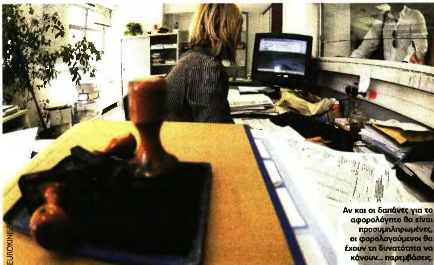
Αν και οι δαπάνες για το αφορολόγητο θα είναι προσυμπληρωμένες, οι φορολογούμενοι θα έχουν τη δυνατότητα να κάνουν... παρεμβάσεις.

Ειδικά για τις πληρωμές μέσω τραπεζικού λογαριασμού, τα στοιχεία που έχουν αποσταλεί υπολογίσθηκαν με βάση τους επαγγελματικούς λογαριασμούς που έχουν καταχωρηθεί στη σχετική εφαρμογή της ΑΑΔΕ και αφορούν αναδρομικά σε όλες τις συναλλαγές του 2017, εφόσον ο δικαιούχος έχει δηλώσει ότι ο επίμαχος