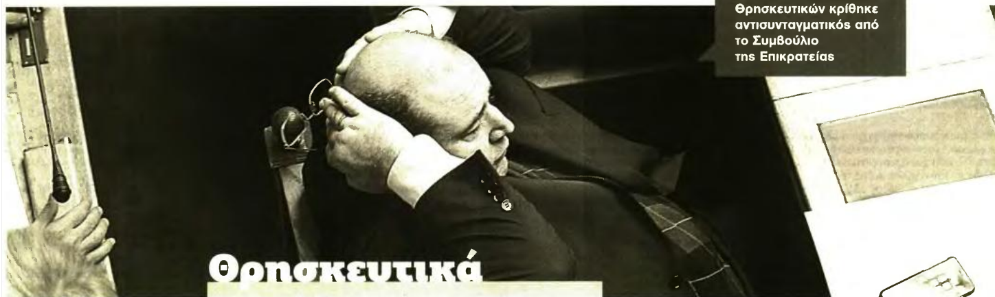
Ο νόμος Φίλη για τον τρόπο διδασκαλίας των Θρησκευτικών κρίθηκε αντισυνταγματικός από το Συμβούλιο της Επικρατείας