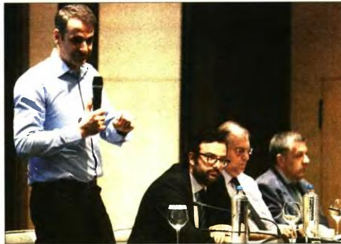
Ο Κυριάκος Μητσοτάκης κατά την ομιλία του στην εκδήλωση της Ακαδημίας Στελεχών της Ν.Δ. στη Θεσσαλονίκη

Κ ι όταν μιλάμε για εισοδήματα, μιλάμε για το διαθέσιμο εισόδημα . Δεν μιλάμε μόνο για τον μισθό τον οποίο θα παίρνεις, μιλάμε για το τι σου μένει τελικά, μετά τις εισφορές και μετά τους φόρους που θα κληθείς να πληρώσεις. Διότι εδώ πέρα συμβαίνει το εξής παράδοξο: Οι μισθοί μπορεί να είναι σχετικά χαμηλοί , αλλά το κόστος εργασίας για έναν εργοδότη , εάν προσμετρήσεις και τις ασφαλιστικές εισφορές, είναι πολύ μεγαλύτερο . Κατά συνέπεια, δεν είμαστε ανταγωνιστικοί κι αν κάποιος νέος άνθρωπος βάλει κάτω τι του μένει στην τσέπη σε σχέση με το να πάει, ας πούμε, στην Κύπρο ή στη Γαλλία ή στην Αγγλία, διαπιστώνει ότι για την ίδια προσωπία θα κερδίζει πολύ περισσότερα χρήματα . Αρα μια άλλη πολιτική, ως προς τους φόρους κι ως προς τις εισφορές, χωρίς αμέσως να αυξηθεί το