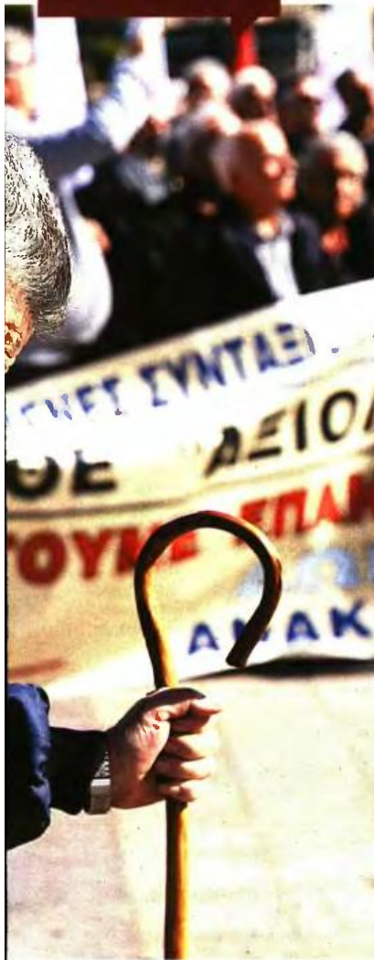
ΑΠΕΛΜΠΕ ΟΡΕΣΤΗΣ ΠΑΝΑΓΙΩΤΟΥ

Η μείωση των συντάξεων θα ανέρχεται στο 18% της προσωπικής διαφοράς, τόσο στις κύριες όσο και στις επικουρικές