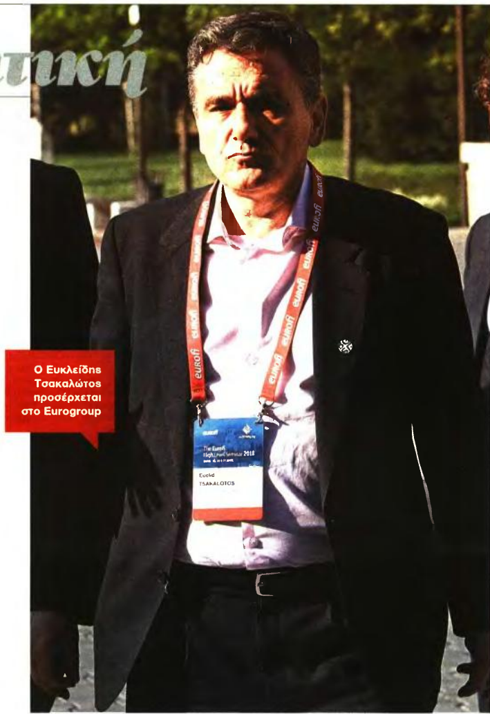
Ο Ευκλείδης Τσακαλώτος προσέρχεται στο Eurogroup

ΝΕΟΣ ΓΥΡΟΣ. Την επόμενη Δευτέρα, φτάνουν στην Αθήνα για έναν ακόμα γύρο αξιολόγησης οι επικεφαλής του κουαρτέτου των δανειστών με πολλά από τα στοιχεία του παζλ της επόμενης ημέρας ακόμα συγκεχυμένα. Η κυβέρνηση καλείται πρώτα απ' όλα να φτάσει σε τεχνική συμφωνία με τους δανειστές έως τις 24 Μαΐου που είναι προγραμματισμένη η επόμενη συνεδρίαση του Eurogroup. Από τη λίστα των 88 προπαιτούμενων περιπτώσεων εννέα στα δέκα παραμένουν μέχρι σήμερα σε εκκρεμότητα, όταν στο σύνολό τους οι εκπρόσωποι των δανειστών έχουν τονίσει την ανάγκη ταχείας ολοκλήρωσης της τέταρτης αξιολόγησης. Όλα τα εμπλεκόμενα υπουργεία θα πρέπει να αποδουθούν σε έναν αγώνα δρόμου ώστε το αργότερο στις 21 Ιουνίου όλα τα προπαιτούμενα να έχουν κλείσει. Το πρόβλημα στην τελευ-