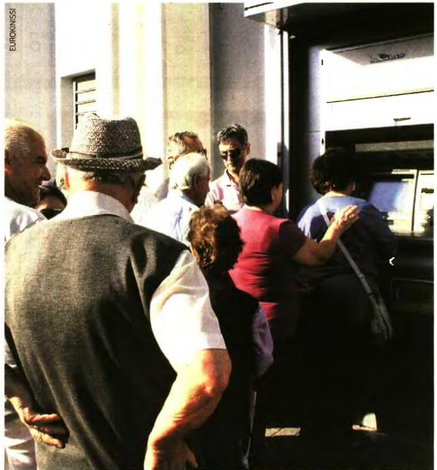
Οι επιστροφές θα είναι έως και 100 ευρώ για 22.990 συνταξιούχους, από 101 έως 300 ευρώ για 120.087 συνταξιούχους, από 301 έως 700 ευρώ για 48.695 συνταξιούχους και από 701 έως 1.228 ευρώ για 5.125 συνταξιούχους.

Ειδικότερα, με tweet της η κυρία Εφη Ακτσιόγλου ανέφερε χαρακτηριστικά: «Με την πληρωμή των επικουρικών τους συντάξεων, στις 2 Αυγούστου, περίπου 200.000 συνταξιούχοι θα λάβουν τα αναδρομικά ποσά που προέκυψαν από την αλλαγή στον υπολογισμό της εισφοράς υπέρ του ΑΚΑΓΕ, η οποία έχει γίνει από τον Μάιο».