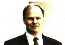
►► ΠΙΤΕΡ ΝΤΟΛΜΑΝ

Αναφορά γίνεται στην έκθεση και για την περαιτέρω χαλάρωση των capital controls. Όπως τονίζεται, οι ελληνικές Αρχές έχουν έναν οδικό χάρτη για την περαιτέρω χαλάρωσή τους, λαμβάνοντας υπόψη το επίπεδο της ρευστότητας και την κατάσταση της οικονομίας. Ωστόσο, πρόθεσή τους είναι η ταχεία άρση των περιορισμών, χωρίς περαιτέρω καθυστερήσεις, που θα ήταν επιζήμιες όσον αφορά την ενίσχυση της εμπιστοσύνης.