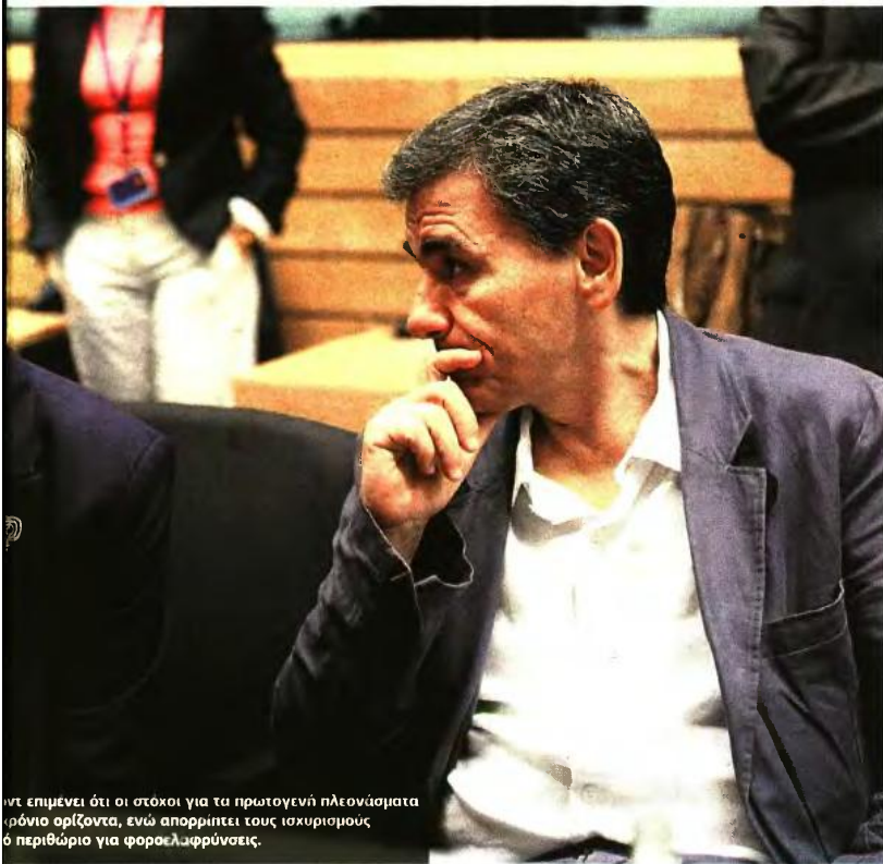
...ντ επιμένει ότι οι στόχοι για τα πρωτογενή πλεονάσματα... ...ρόνιο ορίζοντα, ενώ απορρίπτει τους ισχυρισμούς... ...ό περιθώριο για φοροελαφρύνσεις.