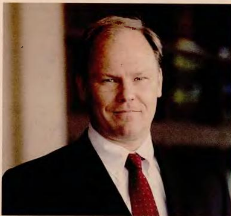
«Η Ελλάδα πρέπει να αντιμετωπίσει αυτή την κληρονομιά επιτυγχάνοντας ταυτόχρονα υψηλότερους ρυθμούς βιώσιμης ανάπτυξης και παραμένοντας ανταγωνιστική στην Ευρώπη», λέει ο επικεφαλής του ΔΝΤ στην Ελλάδα, Πίτερ Ντόλμαν.

ρωπαίων πιστωτών θα ωριμάζει και θα αντικαθίσταται από πιο ακριβό χρέος από την αγορά, η ικανότητά της να το εξυπηρετεί θα αποτελεί σταδιακά όλο και μεγαλύτερη πρόκληση. Η Ελλάδα θα κληθεί να επιτυγχάνει ταυτόχρονα υψηλούς ρυθμούς ανάπτυξης και υψηλά πρωτογενή πλεονάσματα επί πολλά χρόνια, για να κρατήσει το χρέος σε καθοδική πορεία.