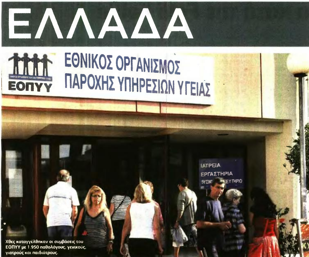
Χθες καταγγέθηκαν οι συμβάσεις του ΕΟΠΥΥ με 1.950 παθολόγους, γενικούς, γιατρούς και παιδίατρος.