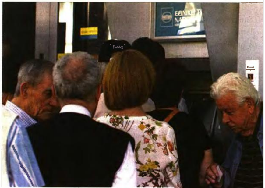
Ενδεικτικά παραδείγματα επιστροφής αναδρομικών από τις παράνομες παρακρατήσεις υπέρ ΑΚΑΓΕ από τις επικουρικές

Ο μεγαλύτερος αριθμός των δικαιούχων αναδρομικών προέρχεται από τα εξής επικουρικά ταμεία: 97.825 συνταξιούχοι του ΟΤΕ, των ΕΛ.ΤΑ., της Αγροτικής Τράπεζας και του ΤΕΑΠΠΕΝ - ΚΕΑΝ, 40.679 του Δημοσίου (ΤΕΑΔΥ) και 24.733 της ΔΕΗ, 16.172 του ΤΕΑΠΟΚΑ, 7.745 του ΤΕΑΥΕΚ, 3.740 του ΤΕΑΠ - ΕΡΤ, 1.774 του ΤΑΝΠΥ, 1.191 των δικηγόρων και 1.089 του ΤΕΑΠΕΤΕ (Εμπορικής Τράπεζας). Οι υπόλοιποι δικαιούχοι προέρχονται από την τ. Τράπεζα Πίστηως,