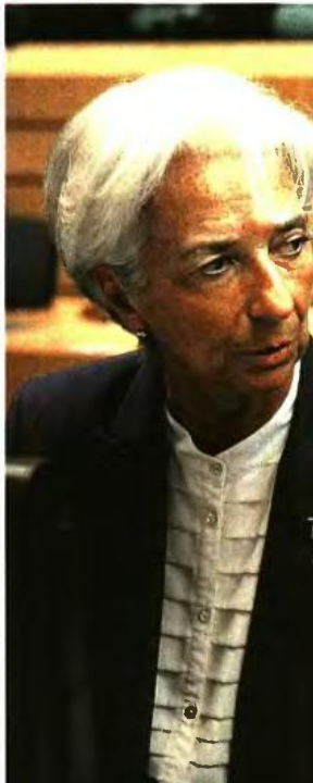
Η επικεφαλής του ΔΝΤ Κριστίν Λαγκάκος δεν μπορούν να επιτευχθούν σε μακροπρόθεσμα όραση ότι υπάρχει δημοσιονομικός

Δεν θα υπάρξουν υπερπλεονάσματα, εκτιμά στην έκθεσή του το Ταμείο και «κλαίει» τα σενάρια για φοροελαφρύνσεις