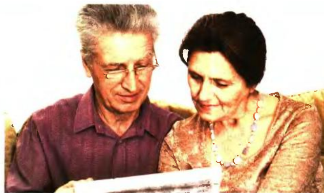
Τα όρια ηλικίας για σύνταξη ΙΚΑ με 10.500 ένησημα έως το 2012 για άνδρες και γυναίκες

4 Όσοι δεν συμπληρώνουν με κανέναν τρόπο ούτε με εξαγορά τις 10.500 ημέρες έως το 2012, αλλά τις έχουν από το 2013 και μετά, παίρνουν πλήρη στα 62, εφόσον έχουν 12.000 ένησημα. Αν δεν έχουν τα 12.000 ένησημα, πάνε στα 67 για πλήρη και στα 62 για μειωμένη. ■