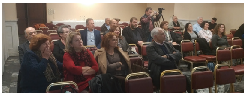
Άποψη του κοινού

Την ανάγκη ορθής διάγνωσης των προβλημάτων του θαλάσσιου οικοσυστήματος, ιδίως της πτώσης των ιχθυοαποθεμάτων τόνισε ο βασικός ομιλητής κ. Κωνσταντίνος Κουτσικόπουλος καθηγητής Βιολογίας του Πανεπιστημίου Πατρών. Είναι σημαντικό τόνισε να έχουμε στοιχεία ώστε να γνωρίζουμε αν η πτώση των πληθυσμών των ψαριών οφείλεται σε καταστροφική αλιεία, υπεραλίευση ή ξενικά εισβολικά είδη. Τα κενά τόσο στη συγκέντρωση στοιχείων, δηλαδή αυτής που προέρχεται από τα κρατικά σημεία ελέγχου όσο και από την επιστημο-