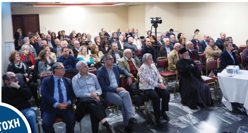
Άποψη του κοινού