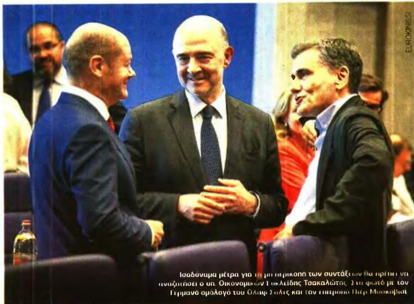
Ισοδύναμα μέτρα για τη μη περικοπή των συντάξεων θα πρέπει να αναζητήσει ο υπ. Οικονομικών Γεώργιος Τσακαλώτος (στη φωτο με τον Γερμανό ομολόγο του Ολίβι Σολις και τον επίτροπο Πιέρ Μοσκοβισί)

Σε ό,τι αφορά την πρώτη μετά το Μνημόνιο αξιολόγηση των θεσμών, περιέγραψε μια διαδικασία που δεν διαφέρει και πολύ από αυτήν που