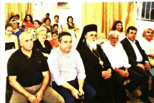
Το «παρών» στην εκδήλωση έδωσαν τα μέλη του Συλλόγου Πολύτεκνων, φορείς του τόπου και φίλοι του Συλλόγου και οι γονείς που συνόδευσαν τα παιδιά τους

Α φιερωμένη στα «Πρωτάκια» των πολύτεκνων οικογενειών που την επόμενη Τρίτη 11 Σεπτεμβρίου θα ξεκινήσουν το σχολείο, ήταν η ζεστή εκδήλωση που πραγματοποιήθηκε χθες το απόγευμα στην αίθουσα εκδηλώσεων του Συλλόγου Πολύτεκνων Πύργου και Περιχώρων, που «πλημύρισε» από παιδικά χαμόγελα.