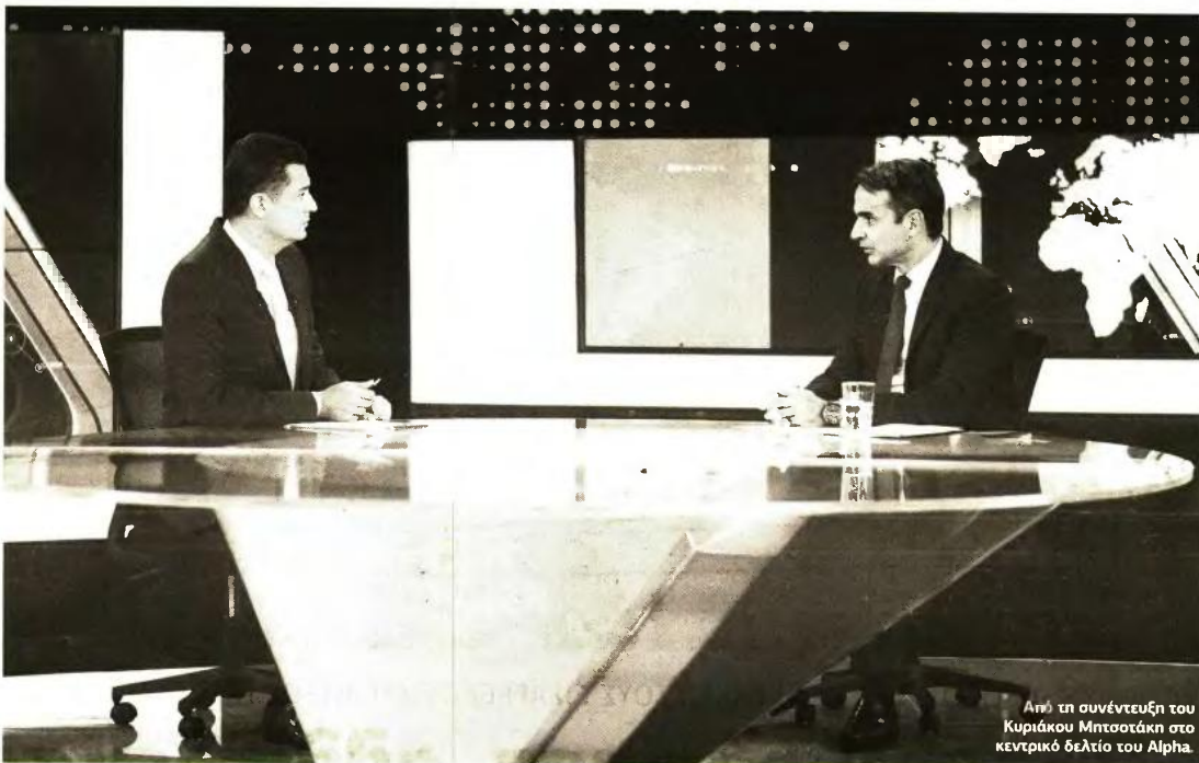
Από τη συνέντευξη του Κυριάκου Μητσοτάκη στο κεντρικό δελτίο του Alpha.

«Υποσχέθηκε πρόγραμμα παροχών 12 δισ. όταν γνώριζε ότι θα γίνει πρωθυπουργός, τώρα που ξέρει ότι χάνει πιστεύετε ότι θα δείξει αυτοσυγκράτηση να υποσχεθεί και πάλι πράγματα που δεν έχει καμία δυνατότητα να κάνει», σχολίασε, ενώ