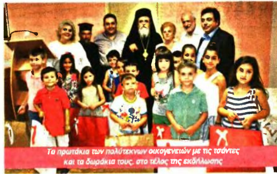
Τα πρωτάκια των πολύτεκνων οικογενειών με τις τσάντες και τα δωράκια τους, στο τέλος της εκδήλωσης