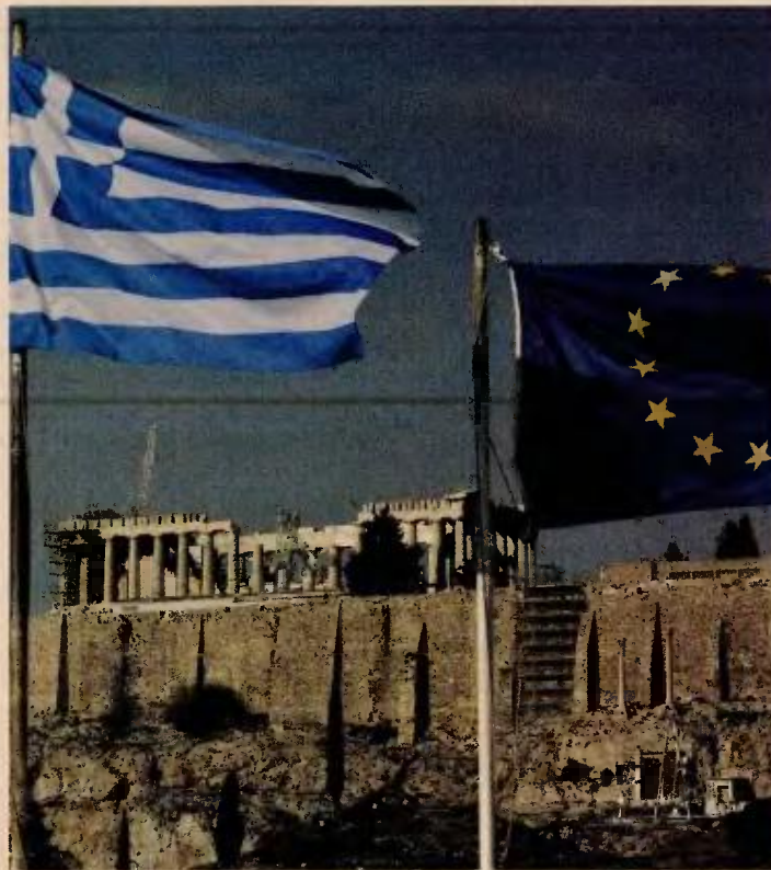
Οι θεσμοί επιστρέφουν στην Αθήνα στις 10 Σεπτεμβρίου και θα έχουν μια πρώτη συζήτηση για το επίμαχο θέμα των συντάξεων με την κυβέρνηση.

Ο βασικός σκοπός του πρώτου αυτού ελέγχου είναι να γίνουν οι προκαταρκτικές συζητήσεις για τον επόμενο προϋπολογισμό ενώ ο στόχος θα είναι να σταλεί ένα θετικό σήμα στις αγορές ότι η Ελλάδα βρίσκεται στον δρόμο