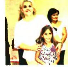
Όλα τα παιδιά πήραν από μια σχολική τσάντα, με την ευχή όλων να τη γεμίσουν με γνώσεις και πολύτιμα εφόδια για τη ζωή τους