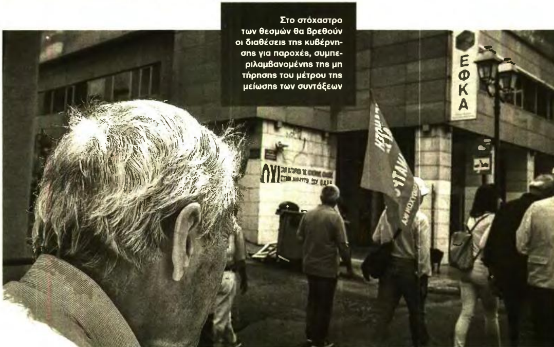
Στο στόχαστρο των θεσμών θα βρεθούν οι διαθέσεις της κυβέρνησης για παροχές, συμπεριλαμβανομένης της μη τήρησης του μέτρου της μείωσης των συντάξεων

Παράλληλα, όμως, τόνισε ότι το Eurogroup θέλει να δει την Ελλάδα να τηρεί τις δεσμεύσεις της και να εμφανίζει πλεόνασμα 3,5%. Μάλιστα, ο αξιωματούχος της Κομισιόν προειδοποίησε την κυβέρνηση ότι σε περίπτωση μη συμμόρφωσης με τους θεσμούς, μια αρνητική έκθεσή τους μπορεί να προκαλέσει αρνητική αντίδραση στις αγορές, οι οποίες είναι «εύθραυστες» εξαιτίας ορισμένων συγκυριών. Μπορεί χάρη στο γενναίο δώρο μαζιλάρι ρευστότητας των 24 δισ. ευρώ η Ελλάδα να μη χρειάζεται να «τρέξει» στις αγορές,