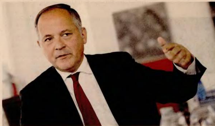
Η συνέχιση των μεταρρυθμίσεων και η αποφυγή υπαναχωρήσεων είναι προϋποθέσεις για την επιστροφή της χώρας στις αγορές, τονίζει ο Μπενουά Κερέ, μέλος της Εκτελεστικής Επιτροπής της ΕΚΤ.

As μιν ξεκινήσει όμως και από πού ξεκινήσαμε. Ποτέ ξανά δεν θα πρέπει μια χώρα της Ζώνης του Ευρώ να περιέλθει σε τέτοια, μη βιώσιμη κατάσταση όπως η Ελλάδα το 2010. Χρειαζόμαστε υγιείς εθνικές δημοσιονομικές και οικονομικές πολιτικές