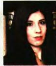
Της ΧΡΙΣΤΙΝΑΣ ΓΛΥΚΟΥ

ΜΕ τη δαμόκλειο σπάθη των (ηλεκτρονικών) πλειστηριασμών να επικρέμαται τους τελευταίους μήνες πάνω από τα κεφάλια των οφειλετών και να αποτελεί πλέον ζοφερή πραγματικότητα και εφιάλτη αυτών, ας δούμε αναλυτικά πώς μπορεί να αμυνθεί ο οφειλέτης σε κάθε στάδιο, από την καταγγελία του τραπεζικού προϊόντος μέχρι τη διεξαγωγή του ηλεκτρονικού πλειστηριασμού, και ποια δικονομικά όπλα και ποιους τρόπους άμυνας διαθέτει για προστασία της περιουσίας του, ακόμα και στο παρά 5'.