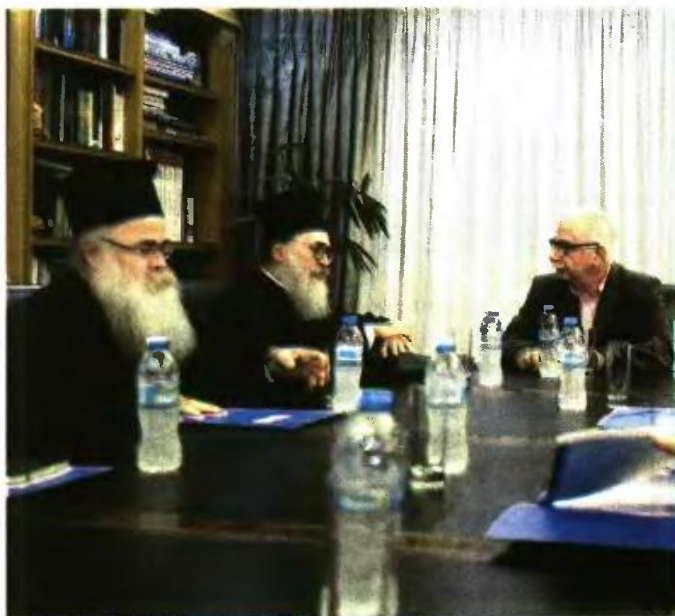
Μετά το τέλος της μαραθώνιας συνάντησης του υπουργού Παιδείας με τους εκπροσώπους της Εκκλησίας της Κρήτης οι δύο πλευρές συμφώνησαν ότι... διαφωνούν σε όλα.