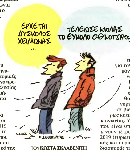
ΤΟΥ ΚΩΣΤΑ ΣΚΛΑΒΕΝΤΗΣ

Στο εσωτερικό της κυβέρνησης όμως διατυπώνονται εκ διαμέτρου αντίθετες απόψεις για τον χρόνο των εκλογών, ενώ η μόνη σταθερά στην παρούσα χρονική στιγμή είναι η άποψη του Πρωθυπουργού ότι οι κάλπες πρέπει να στηθούν τον προσεχέ Οκτώβριο διότι, όπως λείει, θα αποδώσει καρπούς η οικονομική πολιτική με θετικά μέτρα σε βάθος χρόνου και θα γίνει πλήρως κατανοητή από μεγάλο τμήμα της κοινωνίας. Υπάρχει μια ομάδα υπουργών που είναι υποστηρικτές του σεναρίου να γίνουν τετραπλές εκλογές τον Μάιο του 2019 (ευρωεκλογές, βουλευτικές, δημοτικές και περιφερειακές) με τη λογική της διασποράς της ψήφου.