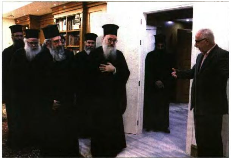
Ο Κ. Γαβρόγλου, υποδεχόμενος χθες αντιπροσωπία της Εσκλησίας της Κρήτης

νητική κατάληξη των συνομιλιών, ο Κώστας Γαβρόγλου ανακρίνωσε εύσχημα ότι υπάρχει διαφορά προσεγγίσεων από την Εκκλησία της Κρήτης. Αξιο αναφοράς είναι πως ο υπουργός Παιδείας σταμάτησε να χρησιμοποιεί τον όρο του Αλέξη Τσίπρα «ιστορική συμφωνία», υιοθετώντας μια διατύπωση εγγύτητα σε αυτή του Αρχιεπισκόπου Ιερωνύμου, ότι πρόκειται για «πλαισίου συμφωνίας ανάμεσα στην Εκκλησία της Ελλάδος και στην ελληνική κυβέρνηση».