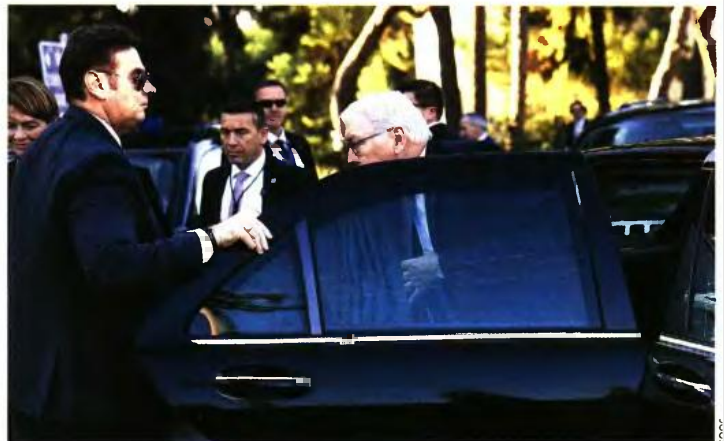
Οι άνδρες με τα μαύρα γυαλιά συνόδευσαν παντού τον πρόεδρο της Γερμανίας Frank-Walter Steinmeier