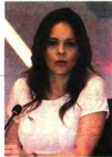
Η θέση της υπουργού Εργασίας

λυτικά προαναφέρθηκε, οι κύριες συντάξεις που υπερβαίνουν τα 1.300 ευρώ και οι επικουρικές συντάξεις, με κλιμάκωση του ποσοστού μειώσεως (10%, 15% και 20%) αναλόγως του ύψους αυτών και με κατοχύρωση κατώτατου ορίου 200 ευρώ, καθώς και ο ν. 4093/2012, με το άρθρο πρώτο του οποίου, αφ' ενός μεν μειώθηκαν εκ νέου, σε ποσοστό από 5% έως και 20%, οι από οποιαδήποτε πηγή και για οποιαδήποτε αιτία συντάξεις, που υπερβαίνουν αθροιστικώς τα 1.000 ευρώ, αφ' ετέρου δε καταργήθηκαν πλέον για όλους τους συνταξιούχους τα επιδόματα και δώρα Χριστουγέννων, Πάσχα και αδείας. Οι τελευταίες ως άνω διατάξεις ψηφίσθηκαν όταν είχε πλέον παρέλθει διετία από τον πρώτο αφηρηδισμό της οικονομικής κρίσεως και αφού εν τω μεταξύ είχαν σχεδιασθεί και ληφθεί τα βασικά μέτρα για την αντιμετώπισή της. Αυτή η απόφαση της Ολομέλειας του Ανωτάτου Δικαστηρίου, η οποία συνεδρίασε υπό την προεδρία, τότε, του Σ. Ρίζου, είχε ουσιαστικά προαναγγείλει το διάστημα που προηγήθηκε μέχρι τον Ιούνιο του 2015 από τα αποτελέσματα των διασκέψεων που είχαν γίνει. Επισημαίνεται ότι η απόφαση του ΣτΕ δεν είχε αναδρομική ισχύ, αλλά αφορούσε μόνο τους 15 συνταξιούχους που προσέφυγαν στο ΣτΕ. Σύμφωνα με εκτιμήσεις νομικών κύκλων -που όμως δεν έχουν επιβεβαιωθεί- την περίοδο εκείνη περίπου 2.000 συνταξιούχοι είχαν προσφύγει στα διοικητικά δικαστήρια ανά τη χώρα επιδιώκοντας το ίδιο αποτέλεσμα. Δηλαδή, την επιστροφή των χρημάτων που κατά τη γνώμη τους αντισυνταγματικά τους είχαν περικοπεί.