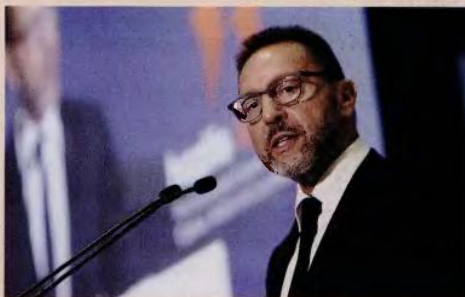
Οι αποδόσεις των ομολόγων του ελληνικού Δημοσίου παραμένουν ευάλωτες και αυξήθηκαν, τόνισε ο διοικητής της ΤτΕ Γ. Στουρνάρας.

πρόοδο που σημειώθηκε και την ελάφρυνση του χρέους, η κρίση έχει αφήσει βαριά κληρονομιά σε τομείς όπως το υψηλό επίπεδο του δημοσίου χρέους, το υψηλό απόθεμα μη εξυπηρετούμενων δανείων, η υψηλή ανεργία, η φυγή υψηλού επιπέδου ανθρώπινου δυναμικού, το επενδυτικό κενό και υψηλά πο-