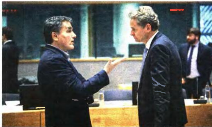
Ο υπουργός Οικονομικών Ευκλείδης Τσακαλώτος με τον επικεφαλής του Ευρωπαϊκού Τμήματος του Διεθνούς Νομισματικού Ταμείου, Πολ Τόμσεν, χθες στις Βρυξέλλες.