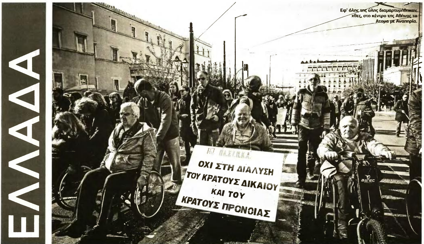
Εφ' όλης της ύλης διαμαρτυρήθηκαν, χθες, στο κέντρο της Αθήνας, τα Άτομα με Αναπηρία.