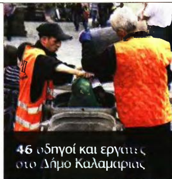
46 οδηγοί και εργάτες στο Δήμο Καλαμαριάς

» Η ΔΕΗ ανακοινώνει την πρόσληψη, με σύμβαση εργασίας ιδιωτικού δικαίου ορισμένου χρόνου, συνολικά πενήντα πέντε (55) ατόμων για την κάλυψη εποχικών ή παροδικών αναγκών του ΑΗΣ Αγίου Δημητρίου που εδρεύει στο Νομό Κοζάνης, και συγκεκριμένα τους εξής: 35 ΔΕ Μηχανοτεχνικοί ΑΗΣ, ΥΗΣ & Αεριστροβίλων, 5 ΔΕ Βοηθοί Χειριστές Ηλεκτροκίνητων ερπυστριοφόρων μηχανημάτων με καδοτροχή και 15 ΔΕ Τεχνίτες Ορυχείων. Οι ενδιαφερόμενοι καλούνται να συμπληρώσουν την αίτηση με κωδικό έντυπο ΑΣΕΠ ΣΟΧ/ΔΕΗ-ΝΙΓ/ΧΕΙΑ/ΑΗΣ/ΥΗΣ/ΑΣΠ/ΤΣΠ.3 και να την υποβάλουν, είτε αυτοπροσώπως είτε με άλλο εξουσιοδοτημένο από αυτούς πρόσωπο, εφόσον η εξουσιοδότηση φέρει την υπογραφή τους θεωρημένη από δημόσια αρχή, είτε ταχυδρομικά με συστημένη επιστολή, στα γραφεία της υπηρεσίας στην ακόλουθη διεύθυνση: ΑΗΣ Αγίου Δημητρίου, Τ.Θ. 1350, Τ.Κ. 50100, Κοζάνη, 2461054305 2461054265. Στην περίπτωση αποστολής των αιτήσεων ταχυδρομικώς το εμπρόθεσμο των αιτήσεων κρίνεται με βάση την ημερομηνία που φέρει ο φάκελος αποστολής, ο οποίος μετά την αποσφράγιση του επισυνάπτεται στην αίτηση των υποψηφίων.