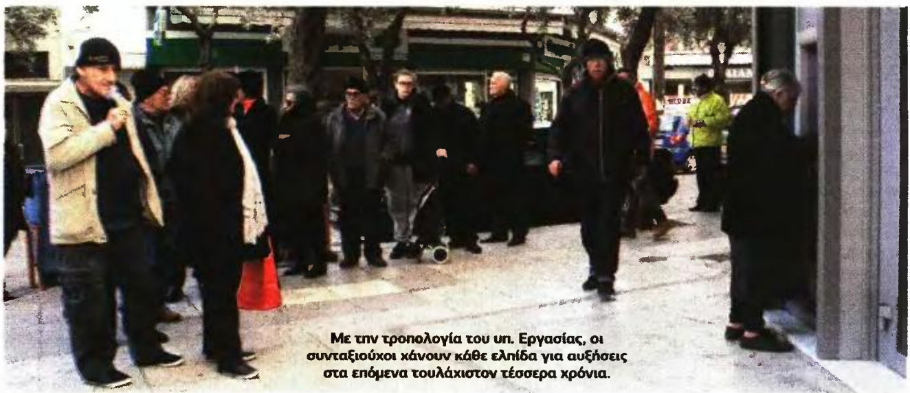
Με την τροπολογία του υπ. Εργασίας, οι συνταξιούχοι χάνουν κάθε ελπίδα για αυξήσεις στα επόμενα τουλάχιστον τέσσερα χρόνια.