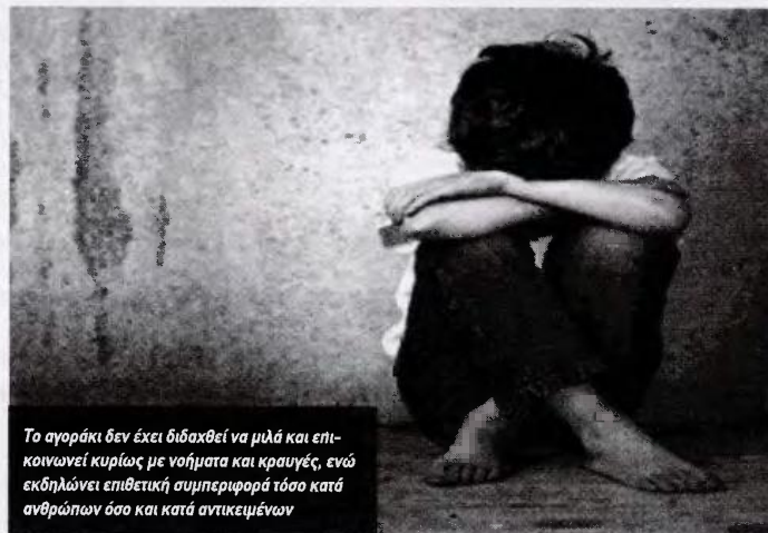
Το αγοράκι δεν έχει διδαχθεί να μιλά και επικοινωνεί κυρίως με νοήματα και κραυγές, ενώ εκδηλώνει επιθετική συμπεριφορά τόσο κατά ανθρώπων όσο και κατά αντικειμένων

ΣΥΓΚΛΟΝΙΖΕΙ η ιστορία ενός τετράχρονου, ο οποίος ζούσε υπό άθλιες συνθήκες, μεγαλώνοντας σε ακατάλληλο οικογενειακό περιβάλλον, σε ένα μισογκρεμισμένο σπίτι στη Ζαγορά Πηλίου. Το 4χρονο παιδί - «αγρίμι», όπως το αποκαλούν, βρήκε εισαγγελέας, συνοδεία αστυνομικών και κοινωνικής λειτουργού, μετά την ανώνυμη καταγγελία που έκανε κάτοικος του συγκεκριμένου χωριού. Όπως διαπιστώθηκε το 4χρονο αγοράκι δεν έχει διδαχθεί να μιλά και επικοινωνεί κυρίως με νοήματα και κραυγές, ενώ εκδηλώνει επιθετική συμπεριφορά τόσο κατά ανθρώπων όσο και κατά αντικειμένων. Την ιστορία απόλυτης φρίκης έφερε στο φως η εφημερίδα Ταχυδρόμος. Η έκθεση της κοινωνικής λειτουργού που ανέλαβε την κοινωνική έρευνα ήταν σοκαριστική. Το παιδί μεγάλωνε κυριολεκτικά σε μία τρώγλη, αφού δεν υπήρχε ταβάνι, ούτε τουαλέτα, ενώ τα κουφώματα από πόρτες και παράθυρα είναι «φαγωμένα» και το χώμα περνά μέσα στο σπίτι. Μάλιστα, η οικογένεια έτρωγε στο πάτωμα, αφού το σπίτι δεν διέθετε καν τραπέζι. Το 4χρονο μεγαλώνει παραμελημένο από τους γονείς του, τον παππού του και τον θείο του, οι οποίοι φέρεται να έχουν ιστορικό ψυχιατρικών νοσημάτων. Το παιδί, αν και είναι ηλικίας 4 ετών, δεν μιλά, ενώ όπου βρίσκεται εκδηλώνει βίαιη συμπεριφορά, κτυπά,