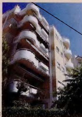
Ο φόρος επιβαρύνει τον πωλητή.

Η δήλωση περιλαμβάνει τα στοιχεία του πωλητή, του συμβολαιογράφου που καταρτίζει τη συμβολαιογραφική πράξη και θα διενεργήσει την παρακράτηση και την απόδοση του φόρου, τα στοιχεία του αγοραστή ή των αγοραστών, τον χρόνο και την αξία κτήσης και μεταβίβασης, το είδος της ακινήτης περιουσίας ή των ιδανί-