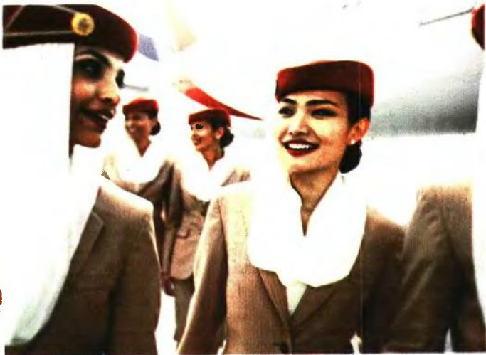
ΗΜΕΡΕΣ ΚΑΡΙΕΡΑΣ ΣΕ ΑΘΗΝΑ ΚΑΙ ΘΕΣΣΑΛΟΝΙΚΗ