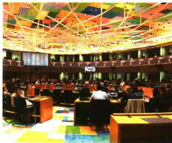
Η απόφαση του Eurogroup στις 19 Νοεμβρίου θα κρίνει το μέλλον των συντάξεων για περίπου ένα εκατομμύριο συνταξιούχους

Ο κ. Ράις είπε την Πέμπτη ότι πρόκειται για μεταρρυθμίσεις που έχουν συμφωνηθεί εδώ και καιρό. Συμπλήρωσε, δε, ότι το ΔΝΤ θεωρεί την εφαρμογή του προνομοθετημένου πακέτου ως μια κίνηση που θα συμβάλει στην απελευθέρωση του δημοσιονομικού χώρου για τις μη συνταξιοδοτικές κοινωνικές δαπάνες και τη μείωση της φορολογικής επιβάρυνσης.