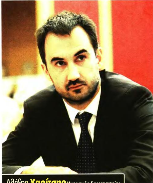
Αλέξης Χαρίτσης Υπουργός Εσωτερικών

Η Τοπική Αυτοδιοίκηση ήταν ένα από τα μεγαλύτερα θύματα της κρίσης. Μόνο τη διετία 2013-14 η κρατική χρηματοδότηση προς τους ΟΤΑ μειώθηκε κατά 60%, ενώ οι προαίτιες πάγωσαν εντελώς, με αποτέλεσμα πολλοί δήμοι να αδυνατούν να προσφέρουν ακόμη και στοιχειώδεις υπηρεσίες. Αυτή την πραγματικότητα αλλάζουμε. Όχι με προεκλογικά μέτρα, αλλά υλοποιώντας έναν μακροχρόνιο σχεδιασμό που περιλαμβάνει το ξεκαθάρισμα των αρμοδιοτήτων μεταξύ κράτους- αυτοδιοίκησης, τις προαίτιες μόνιμου εξειδικευμένου προσωπικού για να καλυφθούν οι ελλείψεις