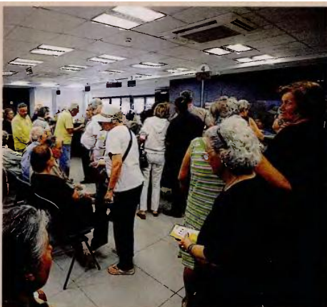
Εάν η νέα σύνταξη υπολείπεται πάνω από 20% από τη σύνταξη που οι δικαιούχοι προσδοκούσαν να λάβουν με τον παλιό τρόπο υπολογισμού, τότε μέχρι την 31η Δεκεμβρίου 2018 θα διατηρηθεί το 25% αυτής της διαφοράς.

και συμπληρωμένο το 55ο έτος της ηλικίας τους το 2011 και το 2012 (μειωμένη). • Ασφαλισμένες στα Ταμεία των ΔΕΚΟ και των τραπεζών με τουλάχιστον 25 έτη ασφάλιστος και συμπληρωμένο το 55ο έτος της ηλικίας τους το 2011. • Ασφαλισμένοι στο ΙΚΑ με 4.500 ημέρες ασφάλιστος, εκ των οποίων 3.600 στα βαρέα, που συμπληρώνουν το 2018 το 62ο έτος της ηλικίας τους (πλήρη σύνταξη). • Ασφαλισμένοι στο ΙΚΑ με 10.500 έσοπμα εκ των οποίων 7.500 στα βαρέα μέχρι την 31/12/2012 και 56 ετών και 6 μηνών λαμβάνουν πλήρη σύνταξη. Εάν τα 10.500 έσοπμα (7.500 βαρέα) συμπληρώθηκαν μέχρι την 31η/12/2013 και είναι 58 ετών και 9 μηνών, θα λάβουν πλήρη σύνταξη μειωμένη κατά 12%. Εάν τα 10.500 έσοπμα (7.500 βαρέα) συμπληρώθηκαν μέχρι την 31/12/2013 και είναι 60 ετών και 9 μηνών, θα λάβουν πλήρη σύνταξη μειωμένη