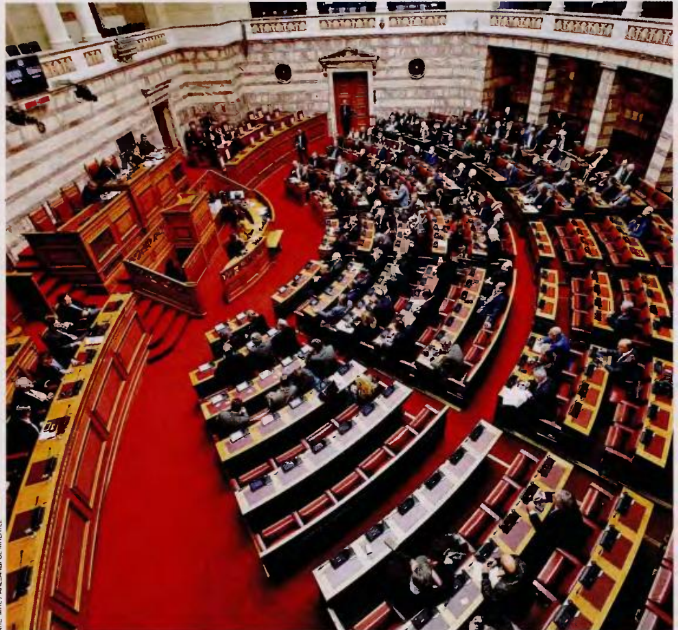
Με το άνοιγμα της Βουλής στις 7 Ιανουαρίου, αναμένεται μια νέα συζήτηση για ζητήματα σχετικά με τον Κανονισμό.

Τα μέσα Ιανουαρίου, πάντως, έχουν επιπρόσθετο κοινοβουλευτικό ενδιαφέρον, καθώς τότε βάσει του αρχικού προγραμματισμού θα πρέπει, ως γνωστόν, να ολοκληρωθεί και καταθέσει προς έγκριση στην Ολομέλεια τις προτάσεις της η Επιτροπή για την Αναθεώρηση του Συντάγματος. Τυπικά, η Επιτροπή θα πρέπει να καταθέσει το σχετικό κείμενο στις 15 Ιανουαρίου, με την αντιπολίτευση κυρίως να πέζει για ολιγοήμερη αναβολή, ώστε να μη συμπεστούν πολύ οι συζητήσεις επί της ουσίας στις έως τότε συνεδριάσεις. Με βάση αυτά, οι δύο ψηφοφορίες που πρέπει ως γνωστόν να ακολουθήσουν επί της συγκεκριμένης προτάσεως, θα ολοκληρωθούν κατά τις τελευταίες εκτιμήσεις έως τον Μάρτιο.