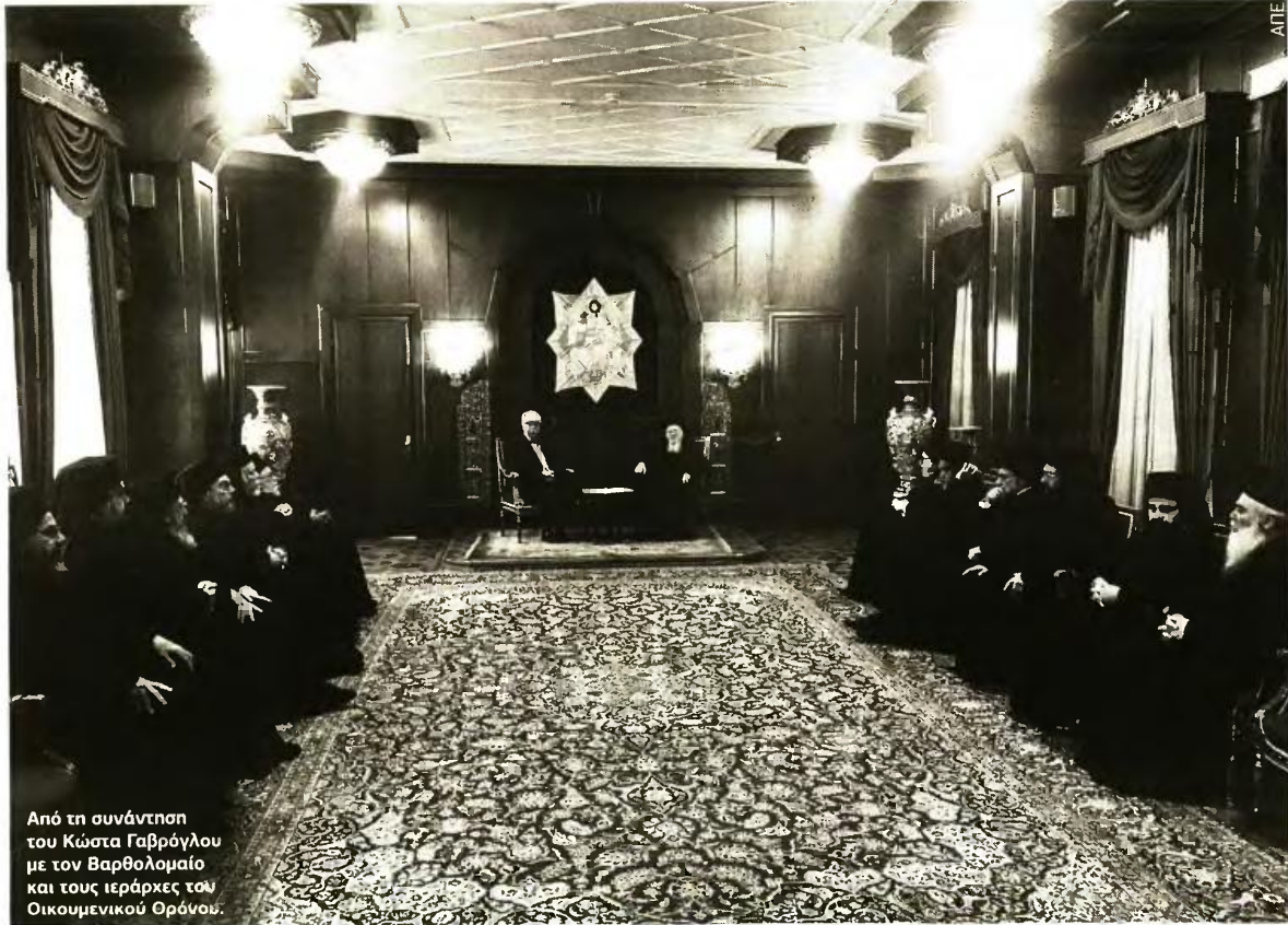
Από τη συνάντηση του Κώστα Γαβρόγλου με τον Βαρθολομαίο και τους ιεράρχες του Οικουμενικού Θρόνου.

ΒΡΟΧΗ ΕΡΩΤΗΣΕΩΝ ΚΑΙ ΠΡΟΒΛΗΜΑΤΙΣΜΩΝ ΑΠΟ ΙΕΡΑΡΧΕΣ ΤΟΥ ΟΙΚ. ΘΡΟΝΟΥ