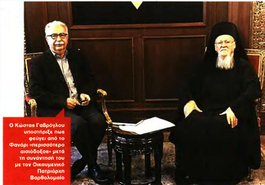
Ο Κώστας Γαβρόγλου υποστήριξε πως φεύγει από το Φανάρι «περισσότερο αισιόδοξος» μετά τη συνάντησή του με τον Οικουμενικό Πατριάρχη Βαρθολομαίο