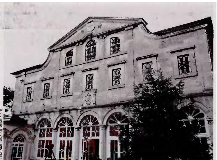
Αποψη του Οικουμενικού Πατριαρχείου Κωνσταντινουπόλεως.

Σε δηλώσεις του μετά τη συνεδρίαση της Ιεράς Συνόδου ο κ. Γαβρόγλου σημείωσε ότι για τη διασφάλιση των ιερών υπάρχει σχέδιο που θα συζητηθεί τις επόμενες ημέρες και με την Εκκλησία της Ελλάδος και με το Οικουμενικό Πατριαρχείο και με την Εκκλησία της Κρήτης. Μάλιστα, για την Εκκλησία της Κρήτης, που υπάγεται πνευματικά και διοικητικά στο Πατριαρχείο, ο κ. Γαβρόγλου ανέφερε ότι στην Κρήτη υπάρχουν 906 οργανικές θέσεις, πολλές εκ των οποίων είναι κενές, και δεσμεύθηκε να καλυφθούν όλες. Ουσιαστικά δηλαδή, δεσμεύθηκε για προσλήψεις, τη στιγμή που η κυβέρνηση ανέφερε ότι με τη συμφωνία Κράτους - Εκκλησίας, που παρουσίασαν στις αρχές Νοεμβρίου ο κ. Αλέξης Τσίπρας και ο κ. Ιερώνυμος θα απελευθερωθούν 10.000 θέσεις δημοσίων υπαλλήλων. «Με τον Οικουμενικό Θρόνο έχουμε προβλήματα με