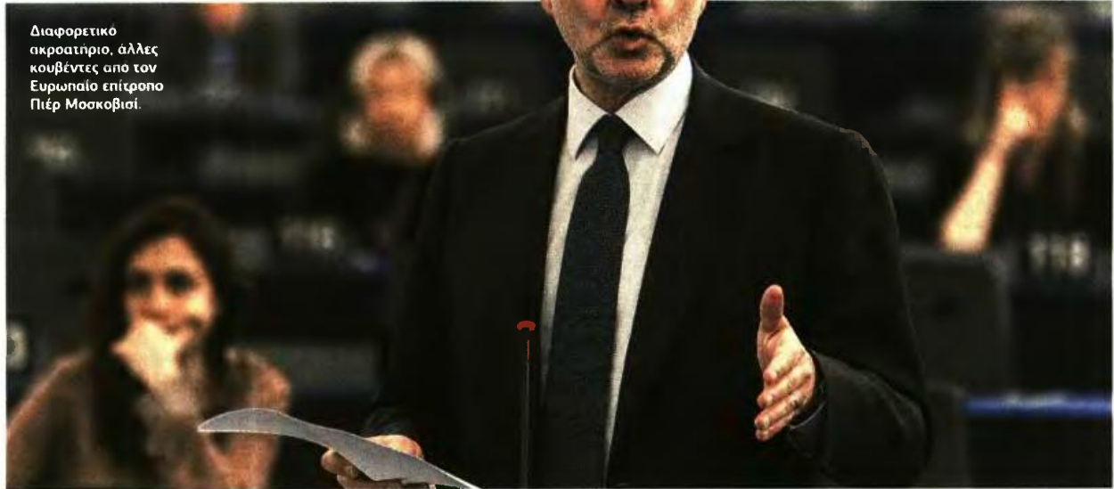
Διαφορετικό ακροατήριο, άλλες κουβέντες από τον Ευρωπαϊκό επίτροπο Πιέρ Μοσκοβισί.

ΟΥΤΕ ΚΟΥΒΕΝΤΑ ΣΤΗΝ ΕΥΡΩΒΟΥΛΗ ΓΙΑ ΜΗ ΕΦΑΡΜΟΓΗ ΤΟΥ ΜΕΤΡΟΥ