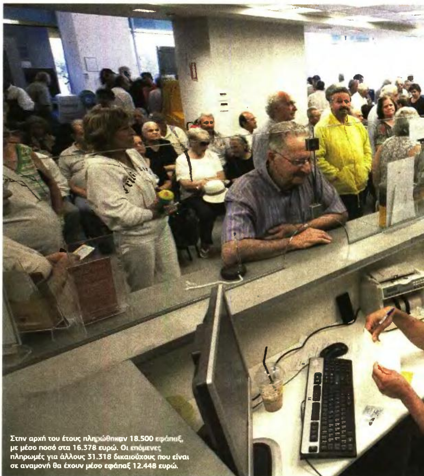
Στην αρχή του έτους πληρώθηκαν 18.500 εφάπαξ, με μέσο ποσό στα 16.378 ευρώ. Οι επόμενες πληρωμές για άλλους 31.318 δικαιούχους που είναι σε αναμονή θα έχουν μέσο εφάπαξ 12.448 ευρώ.

Ο λόγος που διαπιστώνεται το άγριο κούρεμα στα εφάπαξ για πολυπληθείς κατηγορίες ασφαλισμένων είναι διότι ο νόμος Κατρούγκαλου (ν. 4387/2016) δεν μείωσε μόνον τις συντάξεις, αλλά «φρόντισε» να κόψει και σχεδόν να τελειώσει σε λίγα χρόνια και το εφάπαξ.