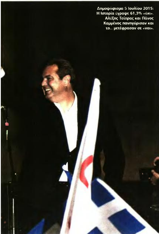
Δημοψήφισμα 5 Ιουλίου 2015: Η Ιστορία έγραψε 61,3% «οχι». Αλέξης Τσίπρας και Πάνος Καμμένος πανηγύρισαν και το... μετέφρασαν σε «ναι».