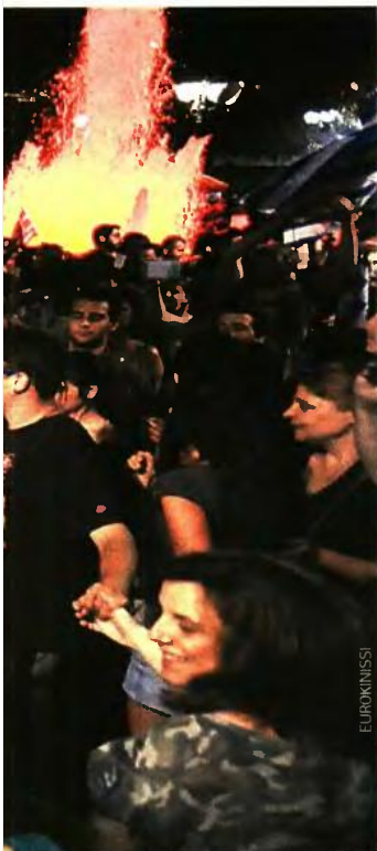
Ευροgroup, 12 Ιουλίου 2015. Λίγες μέρες μετά το δημοψήφισμα. Μόλις άρχισε ο γολγοθός του Ευκλείδη Τσακαλώτου. Είχαν προηγηθεί οι χοροί στο Σύνταγμα για το «περήφανο ΟΧΙ» που όμως έγινε «ΝΑΙ».