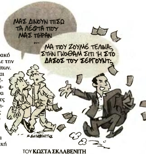
ΤΟΥ ΚΩΣΤΑ ΣΚΛΑΒΕΝΙΤΗ

Ο Πρωθυπουργός αναμένεται να πραγματοποιήσει στοχευμένες επισκέψεις και στην περιφέρεια, ενώ θα επιχειρήσει να αλλάξει το κλίμα και με περιοδείες σε πληγείσες περιοχές. Αυτό έγινε και προχθές, ημέρα απεργίας των ΜΜΕ, όταν επισκέφθηκε το Μάτι και συνομίλησε με αντιπροσωπεία των κατοίκων, ενώ έλαβε και πλήρη ενημέρωση για όλα όσα γίνονται στην περιοχή μετά την τραγωδία.