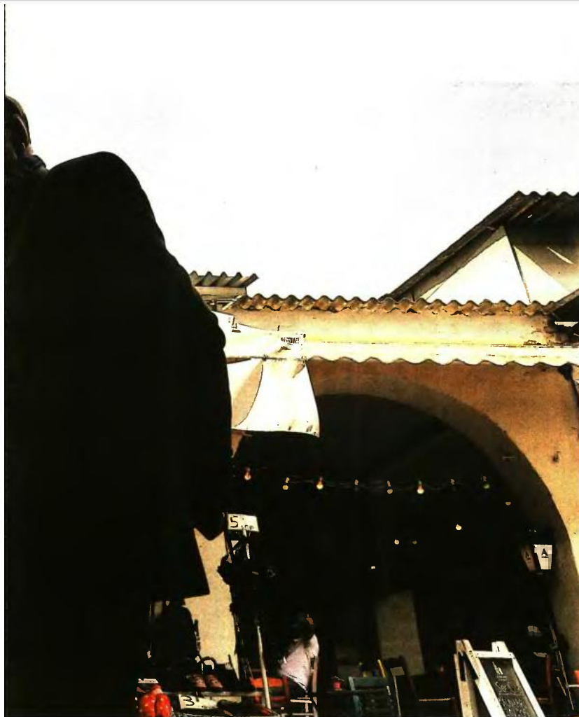
KONSTANTINOS TSAKALIDIS / SDOCC