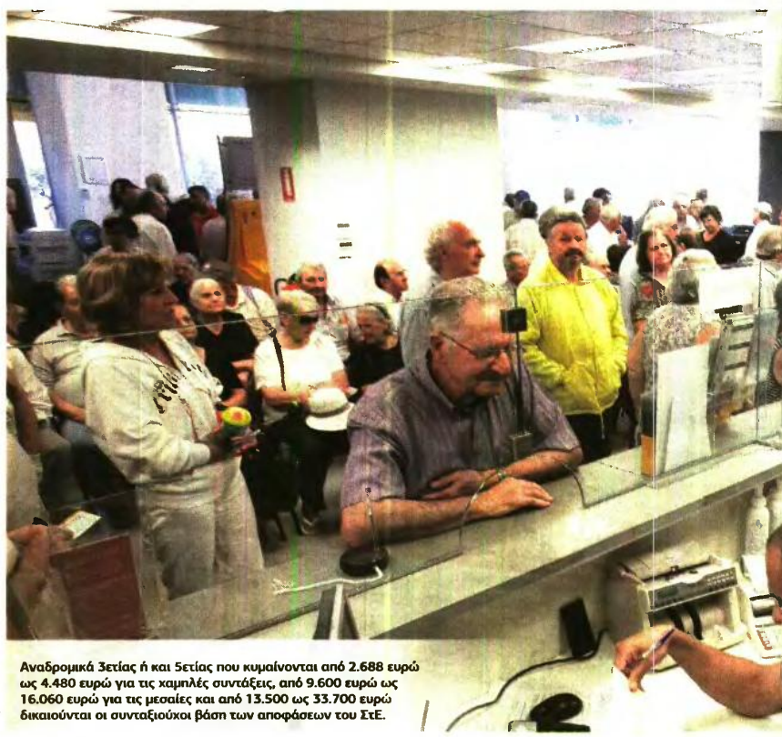
Αναδρομικά Ζετίας ή και Ζετίας που κυμαίνονται από 2.688 ευρώ ως 4.480 ευρώ για τις χαμηλές συντάξεις, από 9.600 ευρώ ως 16.060 ευρώ για τις μεσαίες και από 13.500 ως 33.700 ευρώ δικαιούνται οι συνταξιούχοι βάση των αποφάσεων του ΣτΕ.

Υπερασπιστές... Το οξύμωρο δε, είναι ότι βλέπουμε την κυβέρνηση ΣΥΡΙΖΑΝΕΛ, να υπερασπίζονται τις περικοπές των προηγούμενων κυβερνήσεων (Ν.Δ.-ΠΑΣΟΚ) αρνούμενοι όχι μόνον να τις επιστρέφουν λόγω αντισυνταγματικότητας, αλλά υποστηρίζοντας στις εφέσεις που έχουν ασκήσει ο ΕΦΚΑ και το ΕΤΕΑΕΠ ότι είναι συνταγματικές και έπρεπε να γίνουν για λόγους δημοσίου συμφέροντος! Την ίδια στιγμή, δε, θέλουν να ακυρώσουν τις περικοπές ως 18% που οι ίδιοι ψήφισαν για να ισχύσουν από το 2019! Για λόγους πολιτικού φιλοτομαρισμού και μόνον, αρνούνται να πληρώσουν λογαριασμούς του παρελθόντος τους οποίους θεωρούν απολύτως νόμους και σύμφωνους με το Σύνταγμα, παρά την αντίθετη κρίση του Δικαστικού Σώματος, και την ίδια στιγμή «παρακαλάνε» την τρικόια να δώσει παράταση στις περικοπές που οι ίδιοι ψήφισαν και εν όψει εκλογών δεν θέλουν ούτε να τις θυμούνται!