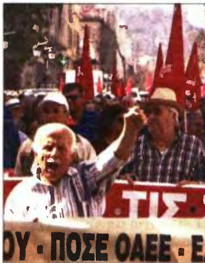
Από τη χθεσινή πορεία συνταξιούχων από όλους τους κλάδους

δοθούν αναδρομικά μετά την ολοκλήρωση της τέταρτης αξιολόγησης. Όσον αφορά το αίτημα αφαίρεσης παρακράτησης στις συντάξεις, στο πλαίσιο επανυπολογισμού των επικουρικών, φέρεται ότι επιώθηκε πως θα γίνει νέος επανυπολογισμός και, εάν διαπιστωθεί αδικία, τα χρήματα αυτά θα αποδοθούν στον δικαιούχο.