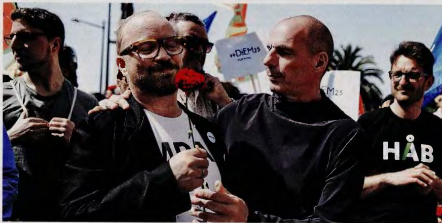
Γορίφαλο στ' αυτί...

Για το λόγο το αληθές, έτερη πηγή μου θύμισε μία αποστορφή της Θεανός Φωτίου σε αντιτοξικό brainstorming με βουλευτές του ΣΥΡΙΖΑ που αντιδρούσαν στην περικοπή των επιδομάτων τριτέκνων και πολιτέκνων τον περασμένο Ιανουάριο: «Και εσάς τι σας νοιάζει αν κόψουμε επιδόματα από ανθρώπους που δεν μας ψηφίζουν;». Τα συμπεράσματα δικά σας.