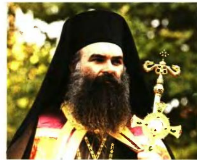
ΕΛΛΑΣΣΩΝΟΣ ΧΑΡΙΤΩΝ «ΔΕΝ ΥΠΑΡΧΟΥΝ ΠΡΟΫΠΟΘΕΣΕΙΣ»

«Ο ρόλοι Εκκλησίας-Κράτους είναι διακριτοί. Τι ακριβώς θα πρέπει να χωρίσουμε; Θα πρέπει να το διευκρινίσει αυτό η κυβέρνηση. Για παράδειγμα, είναι το θέμα της μισθοδοσίας; Μο από τη στιγμή που πήρε από την Εκκλησία την περιουσία της είναι υποχρέωση της Πολιτείας η μισθοδοσία του κλήρου. Δεν θέλουν να πηγαίνουμε στην παρέλαση με τους επισήμους. Ποιο είναι το ζήτημα τελικά της Πολιτείας; Η Εκκλησία σε μια τέτοια συζήτηση δεν έχει να φοβηθεί τίποτα. Η Εκκλησία στην ιστορία της αντιμετώπισε Νέρωνες, Διοκλητιανούς κ.ά. Γιατί όταν ήμε Εκκλησία, εννοούμε τον λαό του θεού. Άρα, τι θα χωρίσουν; Η Πολιτεία θα βάλει διαχωριστικά πλαίσια από τον λαό».