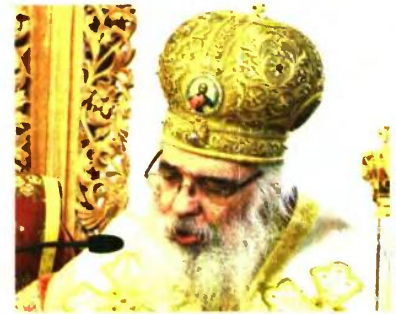
ΕΔΕΣΣΗΣ ΙΩΗΛ «ΟΙ ΡΟΛΟΙ ΕΙΝΑΙ ΔΙΑΚΡΙΤΟΙ»

«Το ελληνικό έθνος έχει ρίζες και βάσεις, κι αυτές είναι η Πίστη και τα εθνικά μας ιδανικά. Ως εκ τούτου, μια συζήτηση που πάει να ξεκινήσει για τον διαχωρισμό, ουσιαστικά αποσκοπεί στην κατάργηση αυτών των βάσεων. Κάτι τέτοιο θα απειλήσει και την ύπαρξη του έθνους. Θεωρώ ότι αυτή τη στιγμή έχουμε πολλές δυσκολίες ως χώρα. Ας λύσουν οι πολιτικοί πρώτα όλα αυτά που ταλαιπωρούν τον λαό και το σύστημα. Κατά την άποψή μου, ούτε τα θέματα οικονομίας έχουν λυθεί, ούτε τα εθνικά μας. Όλα τα θέματα είναι ανοικτά και σε εκκρεμότητα. Όπως με το Σκοπιανό. Διαφωνώ κάθετα με τη συμφωνία για το Σκοπιανό. Ξέρω τα προβλήματα και τα θέματα που θα δημιουργηθούν στο εγγύς μέλλον».