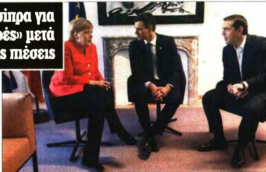
Από την τριμερή συνάντηση Τσίπρα, Μέρκελ, Σάντσεθ στις Βρυξέλλες

«Η Ελλάδα έθεσε στην πρώτη γραμμή αρχές και αξίες. Η Ελλάδα υπερασπίζεται μια μακρά παρακαταθήκη αγώνων και ενός ειδικού αξιακού φορτίου» δικαιολογήθηκε ο κ. Τσίπρας, για να τονίσει στη συνέχεια τις ενδοευρωπαϊκές διαφορές, που όμως δεν αφορούν κανέναν στην Ελλάδα, και τα εθνικά συμφέροντα, τα οποία εν τέλει δεν υπερασπίστηκε αποτελεσματικά. «Φαίνεται ότι δεν μοιραζόμαστε και οι "28" τις ίδιες αρχές και τις ίδιες αξίες της Ευρωπαϊκής Ένωσης - αλληλεγγύη, ουμανισμό, σεβασμό στα ανθρώπινα δικαιώματα και στο διεθνές δίκαιο» πρόσθεσε ο κ. Τσίπρας στο ίδιο... ολόλο μοτίβο. Στην πράξη, όμως, και βάσει της συμφωνίας αλλά