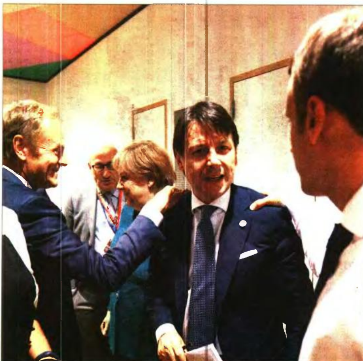
Ντ. Τουσκ, Τζ. Κόντε, Εμ. Μακρόν συνομιλούν στο περιθώριο της Συνόδου Κορυφής

Σύμφωνα με το κοινό ανακοινωθέν, οι εταίροι συμφώνησαν στην ίδρυση κέντρων καταγραφής σε «τρίτες χώρες», που κατά πάσα πιθανότητα θα είναι κράτη της βορείου Αφρικής, ενώ παράλληλα, κράτη-μέλη έχουν το δικαίωμα να δημιουργήσουν οικειοθελώς κέντρα φιλοξενίας στο δικό τους έδαφος -πρόταση που προωθούσαν Γαλλία και Ισπανία-, όπου θα μεταφέρονται κυρίως πρόσφυγες και μετανάστες που διασώζονται σε ευ-