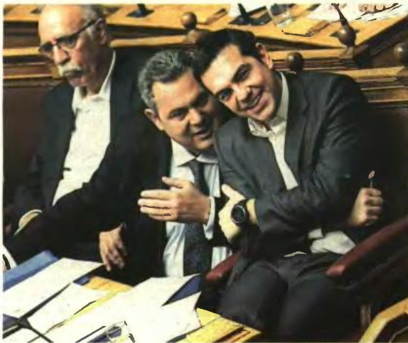
Του Χρήστου Λευκαδίτη

Η απόφαση του ΣΥΡΙΖΑ για διαχωρισμό Κράτους - Εκκλησίας, η αντίθεση των ΑΝΕΛ και τα υπέρ και κατά για τις δύο πλευρές