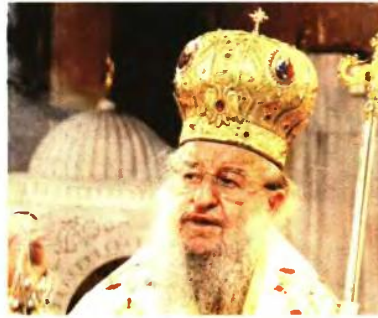
ΘΕΣΣΑΛΟΝΙΚΗΣ ΑΝΘΙΜΟΣ «ΔΕΝ ΕΙΝΑΙ ΩΡΑ ΓΙ' ΑΥΤΟ»

«Το πρόταγμα του λεγόμενου χωρισμού εμπεριλαμβάνεται από προφανώς άμοιρους νομικής παιδείας, οι οποίοι με εφάρτητο το λεγόμενο "θρόνος της αγνοίας τους", θέτουν προς κατεδάφιση ο,τι συνιστά το κράτος δικαίου που επί 200 σχεδόν χρόνια πύργω-ο ο λαός μας με οίμα και ιδρώτα. Οι αντιλήψεις περί χωρισμού είναι του περασμένου αιώνα, που γεννήθηκαν κάτω από μισοαίθρο-δοξη αντίθρονα και αντικληρικαλιστικό λαϊκιστικό πνεύμα, που δεν συμβιβάζεται με τις σημερινές κοινωνικές, πολιτιστικές και θρησκευτικές αντιλήψεις και που αναπτύχθηκε σε προτεσταντικές και παπικές χώρες, που δεν έχουν καμία σχέση με τον πολιτισμό και την ορθόδοξη χριστιανική πίστη του ελληνικού έθνους».