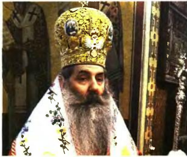
ΠΕΙΡΑΙΩΣ ΣΕΡΑΦΕΙΜ «ΔΜΟΙΡΟΙ ΝΟΜΙΚΗΣ ΠΑΙΔΕΙΑΣ»

«Το πρόταγμα του λεγόμενου χωρισμού εμπεριλαμβάνεται από προφανώς άμοιρους νομικής παιδείας, οι οποίοι με εφάρτητο το λεγόμενο "θρόνος της αγνοίας τους", θέτουν προς κατεδάφιση ο,τι συνιστά το κράτος δικαίου που επί 200 σχεδόν χρόνια πύργω-ο ο λαός μας με οίμα και ιδρώτα. Οι αντιλήψεις περί χωρισμού είναι του περασμένου αιώνα, που γεννήθηκαν κάτω από μισοαίθρο-δοξη αντίθρονα και αντικληρικαλιστικό λαϊκιστικό πνεύμα, που δεν συμβιβάζεται με τις σημερινές κοινωνικές, πολιτιστικές και θρησκευτικές αντιλήψεις και που αναπτύχθηκε σε προτεσταντικές και παπικές χώρες, που δεν έχουν καμία σχέση με τον πολιτισμό και την ορθόδοξη χριστιανική πίστη του ελληνικού έθνους».