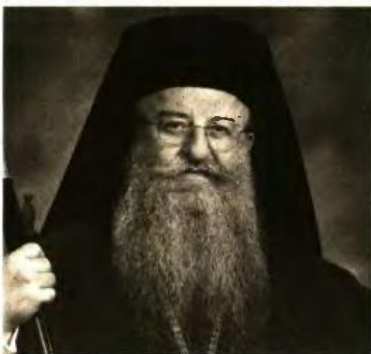
Ο γέρον μτροπολίτης Θεσσαλονίκης Ανθίμος τόνισε ότι η κυβέρνηση δεν υπολογίζει τα σημερινά δεδομένα.

Σε αυτό το κλίμα που διαμορφώνεται αρκετοί ιεράρχες έχουν αρχίσει να καθοβλήθουν τη σύγκληση έκτακτης Ιεραρχίας.