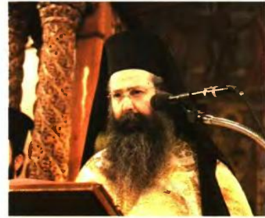
ΚΙΤΡΟΥΣ ΓΕΩΡΓΙΟΣ «Η ΕΚΚΛΗΣΙΑ ΔΕΝ ΦΟΒΑΤΑΙ ΚΑΤΙ»

«Στην πλειοψηφία του ο κλήρος ούτε θέλει να συζητήσει για τον διαχωρισμό ούτε είναι διατεθειμένος να το πράξει. Τα κυβερνητικά στελέχη που προωθούν με δηλώσεις τους την ιδέα διαχωρισμού Κράτους και Εκκλησίας δεν υπολογίζουν τα σημερινά δεδομένα», αναφέρει με δηλώσεις του στα «Π» ο μητροπολίτης Θεσσαλονίκης, κύριος Ανθιμος.