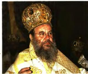
ΝΕΑΣ ΚΡΗΝΗΣ ΙΟΥΣΤΙΝΟΣ «ΘΑ ΑΠΕΙΛΗΘΕΙ ΤΟ ΕΘΝΟΣ»

«Εδώ και πολλά χρόνια οι πολιτικοί ανοίγουν συζητήσεις για τον διαχωρισμό Εκκλησίας-Κράτους. Οι συζητήσεις κλείνουν ωστόσο, γιατί δεν υπάρχει τρόπος να γίνει αυτό. Στην ουσία ούτε το κράτος το θέλει. Και ούτε κι αυτή τη φορά πρόκειται να προχωρήσει κάτι. Εκκλησία και κράτος έχουν λύσει τα θέματά τους. Αυτές οι συζητήσεις γίνονται για άλλους λόγους. Δεν πρόκειται να γίνει και ούτε συμφέρει στην κυβέρνηση να το κάνει. Και δεν θα το κάνει».