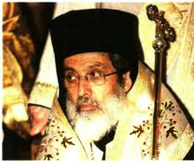
ΣΙΔΗΡΟΚΑΣΤΡΟΥ ΜΑΚΑΡΙΟΣ «ΕΚΚΛΗΣΙΑ ΚΑΙ ΚΡΑΤΟΣ ΕΙΝΑΙ ΕΝΑ»

Εάν και εφόσον κατατεθεί επίσημη πρόταση της Πολιτείας, τότε η Εκκλησία της Ελλάδος διά των αρμοδίων οργάνων της, δηλαδή της Ιεράς Συνόδου της Ιεραρχίας, θα τοποθετηθεί