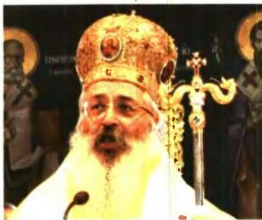
ΑΛΕΞΑΝΔΡΟΥΠΟΛΕΩΣ ΑΝΘΙΜΟΣ «ΤΟ ΚΡΑΤΟΣ ΔΕΝ ΤΟ ΘΕΛΕΙ»

θα τοποθετηθεί», τονίζει ο κ. Κονιδάρης. Στενοί συνεργάτες του κ. Ιερώνυμου υπενθυμίζουν ότι η θέση του παραμένει αυτή που έχει διατυπώσει δημοσίως τον Οκτώβριο του 2016. «Μιλούν για χωρισμό Εκκλησίας και Κράτους, επικαλούμενοι διάθεν προεδρευτικά συνθήματα. Οι αντιλήψεις, όμως, περί χωρισμού είναι του περασμένου αιώνα και γεννήθηκαν κάτω από μισαλλόδοξο αντιθρησκευτικό και αντικληρικαλιστικό λαϊκιστικό πνεύμα, που δεν συμβιβάζεται με τις σημερινές πολιτειακές και θρησκευτικές αντιλήψεις», είχε αναφέρει ο Αρχιεπίσκοπος στη συνέντευξη της Ιεράς Συνόδου, στέλνοντας σαφές μήνυμα στο Μαξίμου. «Η προσωπική μου άποψη είναι ότι η Πολιτεία ούτε θέλει αλλά ούτε μπορεί, πράγματι, να χωριστεί από την Εκκλησία. Εάν το θελήσει, και έχει τη συγκατάθεση αυτού του λαού, ας το επιχειρήσει, τηρώντας βεβαίως τις υποχρεώσεις που έχει αναλάβει έναντι της Εκκλησίας και τις σχετικές συμβάσεις». Η θέση του ΣΥΡΙΖΑ, που εξέφρασε δημόσια ο πρωθυπουργός, μιλά για ρητή κατοχύρωση της θρησκευτικής ουδετερότητας του κράτους, με διατήρηση όμως για ιστορικούς και πρακτικούς λόγους της αναγνώρισης της Ορθοδοξίας