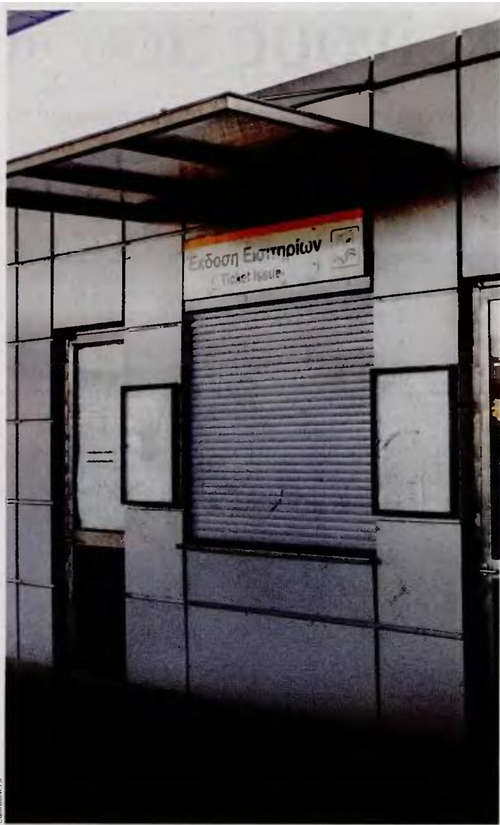
Η μετακίνηση πολλών εργαζομένων των ΣΤΑΣΥ σε θέσεις σταθμαρχών άφησε μεγάλο αριθμό εκδοτηρίων χωρίς προσωπικό.

Πρόσθετο πρόβλημα προκαλεί η απόφαση για διάθεση μειωμένων εισιτηρίων μόνο μέσω της χρήσης προσωποποιημένης κάρ-