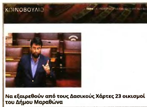
Να εξαιρεθούν από τους Δασικούς Χάρτες 23 οικισμοί του Δήμου Μαραθώνα

Από τη λαλίστατη τις τελευταίες μέρες Ν.Δ. δεν υπήρξε κάποια αντίδραση, ούτε για την ανάρμοστη επίθεση του τομεάρχη της (είπε χαρακτηριστικά ότι ο πρωθυπουργός και η περιφερειάρχης «θέλουν κλοτσιές και δρόμο»), αλλά ούτε και για το γεγονός ότι ο ίδιος με την ερώτησή του το 2016 ουσιαστικά ζητούσε τη νομιμοποίηση μιας περιοχής που στο μεγαλύτερο μέρος της έχει χαρακτηριστεί δασική. Η ερώτηση αφορούσε τις κάτωθι περιοχές: «Δημοτική Ενότητα Μαραθώνα: 1) Πάντειος Πολιτεία, 2) Οικισμός Πολυτέκνων, 3) Συνοικισμός Δικαστικών Υπαλλήλων, 4) Συνοικισμός Συνεταιρισμού Δικαστικών-Εισαγγελέων, 5) Μπέι, 6) Ανω Σκινιάς-Αύρα, 7) Κοτρύνα, Δ.Ε. Βαρνάβα: 1) Περιοχή Καλιγιωργα, 2) Περιοχή Προφήτης Ηλίας, Δ.Ε. Γραμματικού: 1) Πυργανθι-Τοπιτσα, 2) Σκαλελα-Φερθι-Αγία Τριάς, 3) Οικισμός Συνεταιρισμού Αστυνομίας Πόλεων, 4) Φουσκαζα και Δ.Ε. Νέας Μάκρης: 1) Περιοχή Αγίας Μαρίας, 2) Οικισμός Συνεταιρισμού Βιθυνια, 3) Περιοχή Γερο-