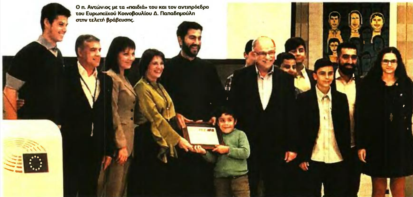
Ο π. Αντώνιος με τα «παιδιά» του και τον αντιπρόεδρο του Ευρωπαϊκού Κοινοβουλίου Δ. Παπαδημούλη στην τελετή βράβευσης.