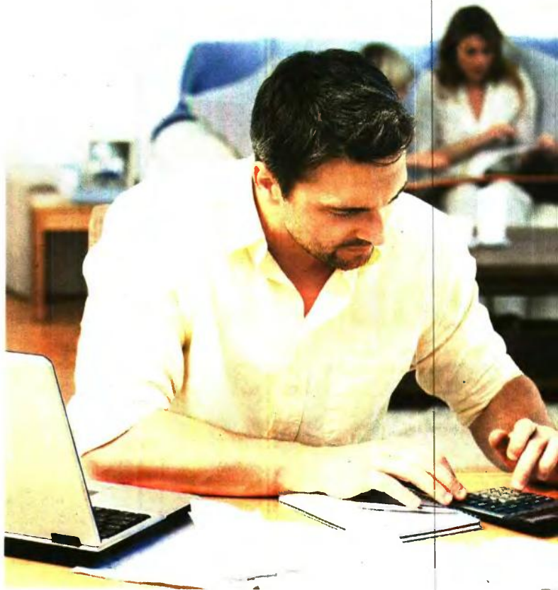
ΟΙ ΕΝΙΣΧΥΣΕΙΣ ΑΝΑΛΟΓΑ ΜΕ ΤΟ ΕΙΣΟΔΗΜΑ ΚΑΙ ΤΑ ΠΑΙΔΙΑ

Για παράδειγμα, φοιτητής που χρησιμοποιεί δελτίο παροχής υπηρεσιών για περιστασιακή απασχόληση, και δήλωσε 1.500 ευρώ για το 2017, φορολογείται για τεκμαρτό εισόδημα 3.000 ευρώ! Αυτό το εισόδημα προστίθεται στο πραγματικό ή τεκμαρτό εισόδημα της οικογένειας (ανάλογα με το ποιο από τα δύο είναι μεγαλύτερο) και ενδέχεται να τους βγάλει εκτός επιδόματος τέκνων! ■