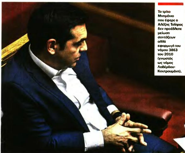
Το τρίτο Μνημόνιο που έφερε ο Αλέξης Τσίπρας δεν προέβλεπε μείωση συντάξεων αλλά εφαρμογή του νόμου 3863 του 2010 (γνωστός ως νόμος Λοβέρδου-Κουτρουμάνη).

Βέβαιες οι μειώσεις του 2019 για τους νέους συνταξιούχους. Για τους παλαιούς μπορεί να κλειδώσουν σε μικρότερα ποσοστά, 9% ή 5%