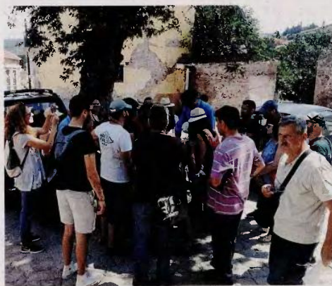
Το Εργαστήριο στη Λέσβο πραγματοποιήθηκε από τις 22 έως τις 24 Ιουνίου, στο πλαίσιο προγράμματος του Πανεπιστημίου του Κεντ.

Ο πρώτος στόχος του Εργαστηρίου ήταν η ενημέρωση των μηχανικών για το αντισεισμικό κατασκευαστικό σύστημα της Λέσβου. Το σύστημα αυτό έχει ερευνηθεί και δημοσιευθεί στην Ελλάδα (2003) και στην Αγγλία (2015). Κατά τη