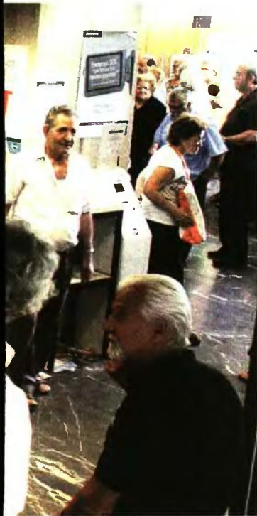
Η ΑΠΟΚΑΛΥΨΗ ΤΟΥ «Ε.Τ.»