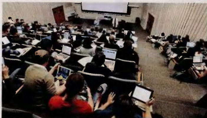
Το μέσο ετήσιο κόστος διαμονής των Ελλήνων φοιτητών στο εξωτερικό ανέρχεται σε 8.373 ευρώ, ξεπερνώντας το αντίστοιχο φοιτητών άλλων ευρωπαϊκών χωρών.

Όσοι αποφασίσουν να σπουδάσουν στο εξωτερικό πρέπει να έχουν υπ' όψιν ότι η τιμολογιακή διαφορά μεταξύ των διαφορετικών κρατών αλλά και πόλεων της ίδιας χώρας είναι συχνά μεγάλη. Στοιχεία που δημοσιοποίησε η παγκόσμια φοιτητική πλατφόρμα student.com αναδεικνύουν τους «καμένους» και τους «κερδισμένους» της παγκόσμιας φοιτητικής κοινότητας που διασκορπίζεται σε 125 πόλεις ανά τον κόσμο με βάση το μίσθωμα που καταβάλλουν. Έτσι, όσοι σπουδάζουν στο Αλμπαθέτε της Ισπανίας, στο Γιοχά-