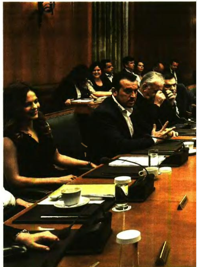
▶▶ ΘΑ ΥΛΟΠΟΙΗΘΟΥΝ ΟΛΕΣ ΟΙ ΔΕΣΜΕΥΣΕΙΣ ΣΤΟΥΣ ΔΑΝΕΙΣΤΕΣ

Πάντως το ΔΝΤ στις υποχωρήσεις που έχει κάνει έως τώρα πρόσθεσε άλλη μία για να παρακαμφθεί το αγκάθι της εφαρμογής του «γαλλικού κλειδιού» υπό όρους, όπως ζητάει η Γερμανία. Έχει ήδη προτείνει να μην υπάρχει η αίρεση εκ των προτέρων αλλά εκ των υστέρων. Δηλαδή ο μηχανισμός αναβολής πληρωμών να ισχύσει χωρίς περιορισμούς και να ανακληθεί αν καταγραφούν αποκλίσεις από τους στόχους που θα πρέπει να πετύχει η Ελλάδα. ■