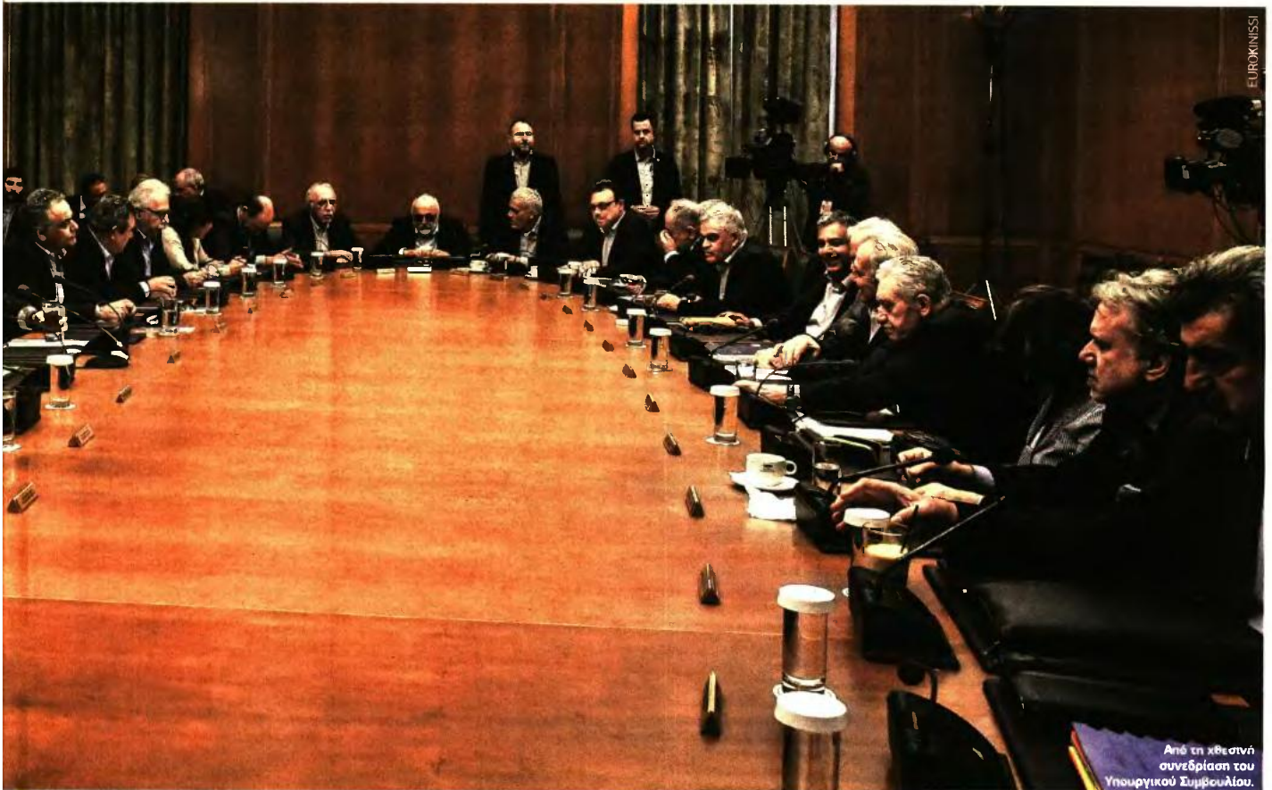
Από τη χθεσινή συνεδρίαση του Υπουργικού Συμβουλίου.