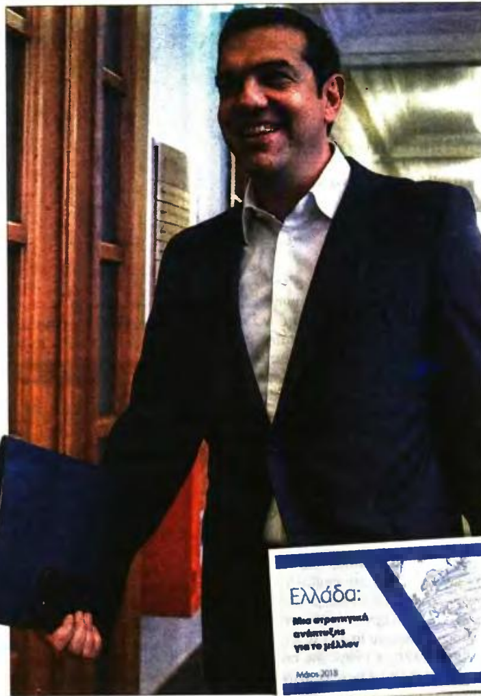
Ο Αλ. Τσίπρας ενώ προσέχεται στο προχθεσινό υπουργικό συμβούλιο, όπου παρουσιάστηκε το ολοιστικό σχέδιο για τη μετά το Μνημόνιο εποχή

Στο φορολογικό πεδίο η κυβέρνηση... οραματίζεται μείωση των φορολογικών συντελεστών μέσω της αντιμετώπισης της φοροδιαφυγής. Η υπόσχεση αυτή γίνεται ακόμα πιο θολή, αν ληφθεί υπόψη η επισήμανση του σχεδίου ότι «ο συνολικός φορολογικός συντελεστής στην Ελλάδα είναι σχετικά υψηλός, αλλά όχι τόσο υψηλός σε ευρωπαϊκή κλίμακα», κάτι που πρόσφατα υποστήριξε δημοσίως ο υπουργός Οικονομικών Ευκλείδης Τσακαλώτος. Η κυβερνητική στρατηγική δεσμεύεται επίσης να συνεχίσει να εισπράττει 2,65 δισ. ευρώ ετησίως από τον Ενιαίο Φόρο Ιδιοκτησίας Ακινήτων (ΕΝΦΙΑ), τον οποίο είχε τόσο πολεμήσει ο ΣΥΡΙΖΑ ως αντιπολίτευση, ενώ υποσχεται επικαιροποίηση των αντικειμενικών τιμών των ακινήτων μέσω ενός μόνιμου μηχανισμού αναπροσαρμογής τους, αξιοποίηση του Περιουσιολογίου και φορολογικά κίνητρα για επενδύσεις.