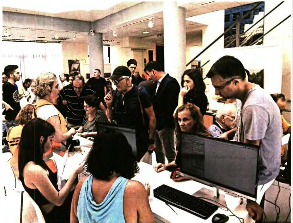
ΜΕ ΤΡΟΠΟΛΟΓΙΕΣ ΣΚΟΥΡΛΕΤΗ, ΑΧΤΣΙΟΓΛΟΥ