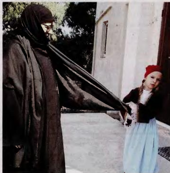
Οι μοναχές αποτελούν την οικογένεια των παιδιών του Λυρείου Ιδρυματος. Η φωτογραφία, από το ντοκιμαντέρ της Βάλερι Κοντάκος «Μάνα».

Σκοπός τους, να δημιουργήσουν κάτι ανάλογο με το πρότυπό τους: το Ιδρυμα Πεσταλότσι (Ελβετία) που προσέφερε καταφύγιο σε παραμελημένα και κακοποιημένα παιδιά. Οι πρωτοεργάτιδες του Λυρείου Παιδικού Χωριού, «η πιο ατίθαση συμμορία στην ιστορία της Ορθόδοξης Εκκλησίας», όπως είχαν χαρακτηριστεί, εδώ και πε-