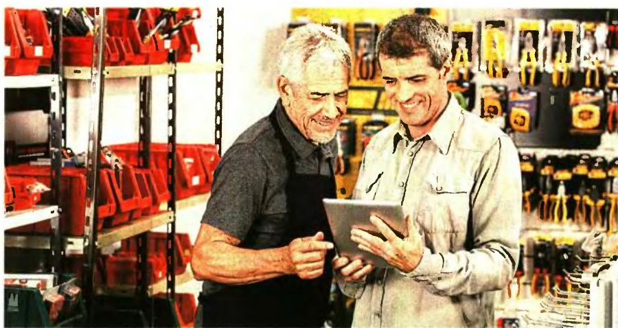
Εάν στα 62 έχουν συμπληρωθεί συνολικά 40 έτη ασφάλισής (12.000 ημέρες) μπορεί να υποβληθεί αίτημα στον ΕΦΚΑ και δεν χρειάζεται παραμονή έως τα 67

Εάν, όπως φαίνεται και από τα στοιχεία που μας δίνετε, συμπληρώσατε την 35ετία το 2017 και συμπληρώνετε φέτος το 58ο έτος της ηλικίας σας, τότε το νέο όριο ηλικίας για την περίπτωση σας είναι το 60ό, το οποίο και συμπληρώνετε το 2019. Η σύνταξή σας θα είναι πλήρης.