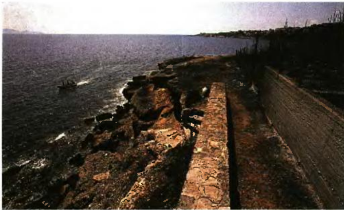
ΑΓΓΕ ΜΠΕ/ΣΥΝΕΛΑ ΠΑΝΤΖΑΡΙΤΖΗ