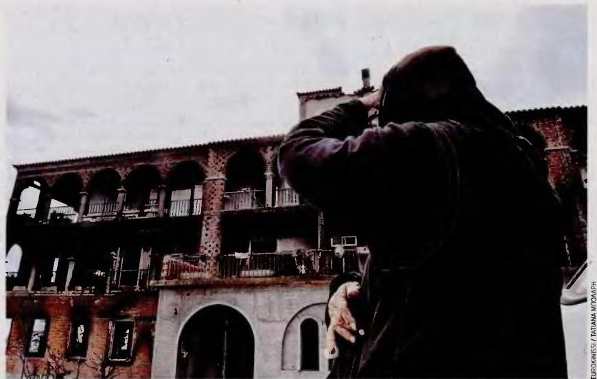
Η πυρκαγιά στο Λύρειο Ιδρυμα, στον Νέο Βουτζά, άφησε πίσω της στάχτη και καταστροφή. Η επιθυμία όμως «να (ξανα)γίνουν τα πράγματα καλύτερα από πριν» παραμένει ζωντανή.