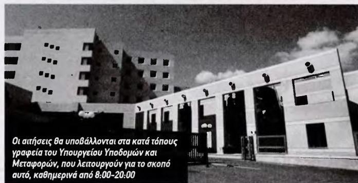
Οι αιτήσεις θα υποβάλλονται στα κατά τόπους γραφεία του Υπουργείου Υποδομών και Μεταφορών, που λειτουργούν για το σκοπό αυτό, καθημερινά από 8:00-20:00

Η ΥΠΟΒΟΛΗ των αιτήσεων για τη χορήγηση της έκτακτης εφάπαξ ενίσχυσης, με τη μορφή επιδόματος, σε πληγέντα φυσικά πρόσωπα και επιχειρήσεις από τις πυρκαγιές στις 23 και 24 Ιουλίου στην Περιφέρεια Αττικής, έχει ήδη ξεκινήσει και λήγει στις 30 Οκτωβρίου 2018. Για τους πληγέντες οι οποίοι δεν πρόλαβαν ή δεν θα μπορούσαν να καταθέσουν την αίτησή τους σύμφωνα με το κατωτέρω πρόγραμμα, θα συνεχιστεί η υποβολή αιτήσεων, αμέσως μετά την ολοκλήρωση του πρώτου κύκλου κατάθεσης των αιτημάτων των πολιτών. Για την υποβολή των αιτήσεων τηρείται σειρά προτεραιότητας, σύμφωνα με την ώρα προσέλευσης των πληγέντων. Οι αιτήσεις θα υποβάλλονται στα κατά τόπους γραφεία του Υπουργείου Υποδομών και Μεταφορών, που λειτουργούν για το σκοπό αυτό, καθημερινά από 8:00-20:00, ανεξάρτητα της περιοχής κατοικίας του πληγέντος. Οι πληγέντες πολίτες συμπληρώνουν τυποποιημένο έντυπο αίτησης διπλής όψης με ενσωματωμένη τυποποιημένη υπεύθυνη δήλωση και απαιτείται μόνο η συμπλήρωση των στοιχείων τους. Σημειώνεται ότι οι πληγέντες, πέραν του έκτακτου επιδόματος των 5.000 ή 6.000 ευρώ για τους τρίτεκνους και πολύτεκνους, για τις κατοικίες, και των 8.000 ευρώ για τις επιχειρήσεις, θα αποζημιωθούν πρόσθετα για τις ζημιές που υπέστησαν τα κτήρια και ο περιβάλλον χώρος, βάσει της κείμενης νομοθεσίας, αμέσως μετά την έκδοση της σχετικής κοινής υπουργικής απόφασης. Ακολουθούν τα σχετικά έντυπα των αιτήσεων.