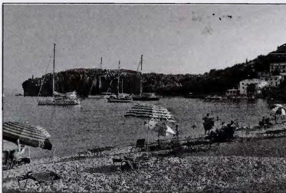
Ο κοινωνικός τουρισμός συνολικά θα έχει 60.000 δικαιούχους, το εκδρομικό πρόγραμμα 12.500 δικαιούχους, ενώ θα δοθούν 150.000 βιβλία και χρηματικό βοήθημα θα χορηγηθεί σε 1.250 πολύτεχνες μητέρες

Ο αριθμός των δικαιούχων του Λογαριασμού Αγροτικής Εστίας που εντάσσονται στα προγράμματα έτους 2018 καθορίζεται κατ' ανώτατο όριο ως εξής: Για το πρόγραμμα επιδοτούμενου κοινωνικού τουρισμού ο αριθμός ανέρχεται στα 60.000 άτομα, εκ των οποίων: α) 55.000 άτομα, μπορούν να πραγματοποιήσουν μέχρι έξι ημέρες διακοπές (πέντε διανυκτερεύσεις) σε συμβεβλημένα με το ΛΑΕ/ΟΠΕΚΑ τουριστικά καταλύματα, β) 4.000 συνταξιούχοι μπορούν να