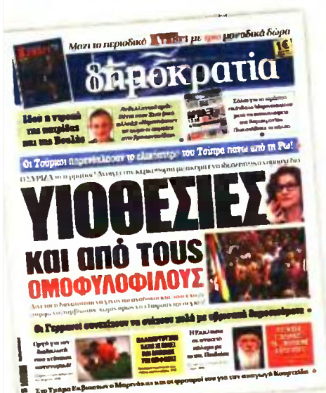
Το πρωτοσέλιδο της χθεσινής «δημοκρατίας»

Αντί του πολιτικού κόσμου τον ρόλο της αντιπολίτευσης αναλαμβάνουν άλλα δημόσια πρόσωπα, όπως ο πρώην διεθνής ποδοσφαιριστής Βασίλης Τσιάρτας, ο οποίος, σε αντιπαράθεσή του με τον Γρηγόρη Βαλλιανάτο μέσω των μέσων κοινωνικής δικτύωσης, τόνισε ότι «κανένα νομοσχέδιο δεν θα μας επιβάλει τις ανώμαλες και αρρωστημένες επιθυμίες σας». Ο Β. Τσιάρτας καταγγέλλει «αρρωστημένα πρότυπα», λέγοντας χαρακτηριστικά ότι «τα παιδιά πρέπει όλα να έχουν στέγη, στοργή και αγάπη, αλλά στα φυσιολογικά πλαίσια που όλοι γνωρίζουμε. Εδώ είναι ΕΛΛΑΔΑ. Δεν είναι ούτε Ολλανδία ούτε Γερμανία ή οποιαδήποτε άλλη χώρα που τα αποδέχεται αυτά».