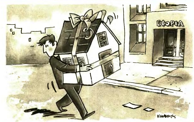
ΕΙΚΟΝΟΓΡΑΦΗΣΗ ΚΩΝΣΤΑΝΤΙΝΟΣ ΣΚΛΑΒΕΝΙΤΗΣ

Στην έρευνα των ελεγκτών για τον εντοπισμό των οφειλετών με