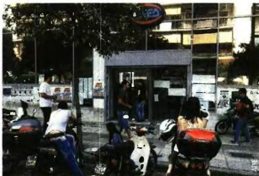
Τον Μάρτιο στην Ελλάδα «συνωστίζονταν» 956.000 άνεργοι.

Σ ε χαμηλά 10 ετών κινήθηκε η ανεργία στην ευρωζώνη και στην Ε.Ε. τον Μάιο, ενώ στην Ελλάδα παραμένει καθλωμένη άνω του 20% και είναι μακράν η χειρότερη επίδοση στην Ευρώπη. Σύμφωνα με τα στοιχεία που δημοσιοποίησε χθες η Eurostat, τον Μάιο η ανεργία στην ευρωζώνη κυμάνθηκε στο 8,4% (αμετάβλητη σε σχέση με τον Απρίλιο), ενώ τον ίδιο μήνα του 2017 βρισκόταν στο 9,2%. Η ανεργία βρίσκεται στο χαμηλότερο σημείο από τον Δεκέμβριο του 2008, δηλαδή πλησιάζει τα προ κρίσης επίπεδα. Στο σύνολο της Ε.Ε. η ανεργία ήταν 7,0% από 7,5% τον Μάιο του 2017. Η ανεργία στην Ε.Ε. βρίσκεται στο χαμηλότερο σημείο από τον Αύγουστο του 2008.