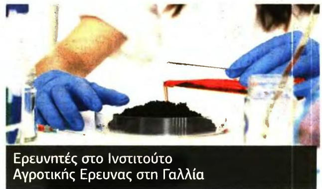
Ερευνητές στο Ινστιτούτο Αγροτικής Έρευνας στη Γαλλία

▶ Το Εθνικό Ινστιτούτο Αγροτικής Έρευνας στη Γαλλία στρατολογεί 41 έμπειρους ερευνητές που είναι γνώστες του σχεδιασμού και της υλοποίησης ερευνητικών προγραμμάτων.