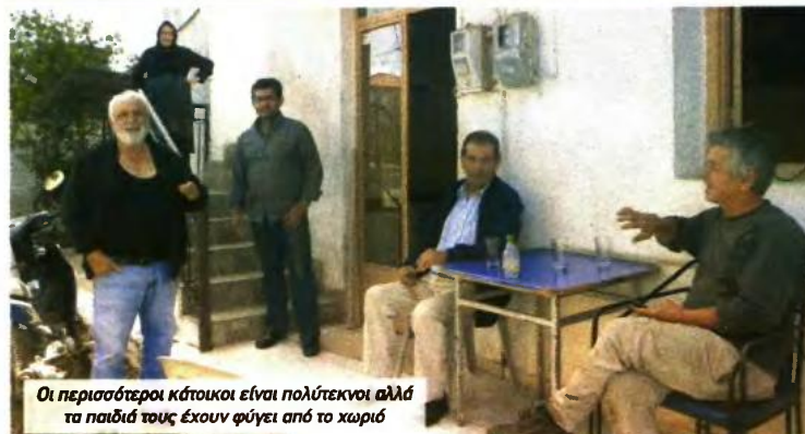
Οι περισσότεροι κάτοικοι είναι πολύτεκνοι αλλά τα παιδιά τους έχουν φύγει από το χωριό