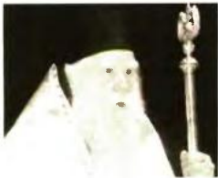
Σε προσωπική εξομολόγηση για τα προβλήματα της υγείας του προχώρησε ο Σεβασμιότατος Μητροπολίτης Ηλείας κ.κ. Γερμανός

Τις εργασίες της ημερίδας παρακολούθησε και ο πρώην βουλευτής Μιχάλης Κατρίνης.