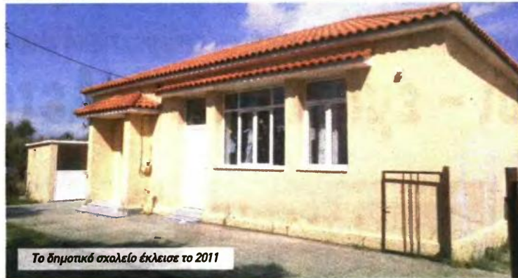
Το δημοτικό σχολείο έκλεισε το 2011