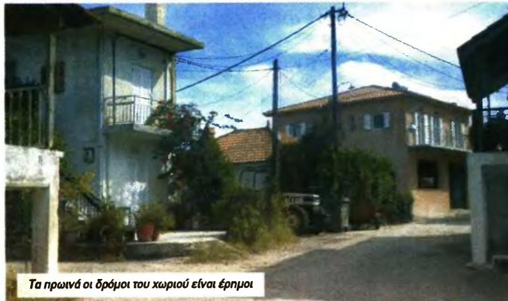
Τα πρωινά οι δρόμοι του χωριού είναι έρημοι

«Εδώ γεννήθηκα και εδώ θα πεθάνω. Τα πράγματα είναι δύσκολα και αντί για καλύτερα γίνονται χειρότερα. Και εγώ είμαι πολύτεκνος, αλλά τα παιδιά μου έχουν πανηρευτεί και έχουν φύγει από το χωριό. Δεν με στενοχωρεί που φεύγουν οι νέοι, γιατί πάνε για μία καλύτερη ζωή. Όλα τα χωριά ερημώνουν, δεν είναι μόνο εδώ, είναι γενικό αυτό. Κάποτε εμείς κάναμε χωράφι με το αλάνι, τα παιδιά δεν μπορούν σήμερα, μπορούν να βρίσουν με το δρεπάνι. Δεν μπορούν. Εγώ πέρασα πολύ δύσκολα χρόνια, δεν θέλω και τα παιδιά μου να περάσουν τέτοια δύσκολα χρόνια. Να ζήσουν μία καλύτερη ζωή».