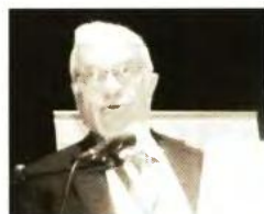
Ο Καθηγητής Μ/Γ και πρόεδρος της Ε.Ε.Α.Ι. αναφέρθηκε στην υπογεννητικότητα στην χώρα μας