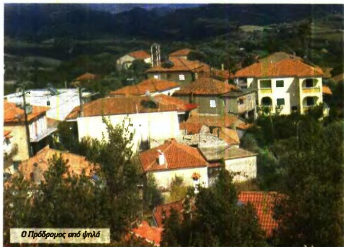
Ο Πρόδρομος από ψηλά