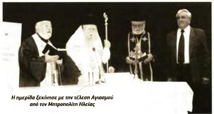
Η ημερίδα ξεκίνησε με την τέλεση Αγιασμού από τον Μητροπολίτη Ηλείας