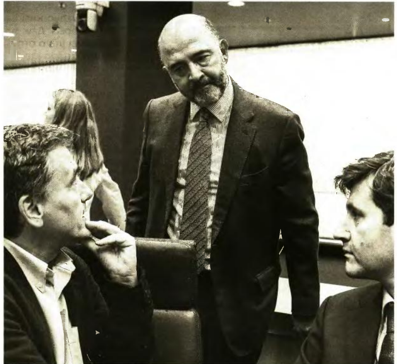
Αύριο ο υπουργός Οικονομικών θα βρεθεί στο Βερολίνο για τη σύνοδο των σοσιαλιστών υπουργών Οικονομικών της Ε.Ε. όπου θα έχει την ευκαιρία να συζητηθεί με τον πρόεδρο του Eurogroup Μάριο Σεντένο και με τον επίτροπο Πιέρ Μοσκοβισί .

Η τρίτη συμφωνία είναι για το αν θα υπάρξει νέα διεκδίκηση το 2019 για αναστροφή του μέτρου της περικοπής του αφορολογήτου και η ανακατανομή τόσο των αντίμετρων που έχουν συμφωνηθεί από το 2017 για τη διετία 2019 και 2020 καθώς