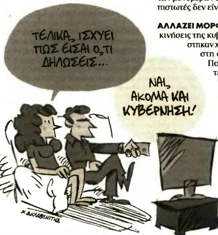
ΤΟΥ ΚΩΣΤΑ ΣΚΛΑΒΕΝΤΗΣ

Επιπλέον, εκτιμάται ότι, εξαιτίας της αβεβαιότητας που επικρατεί στις αναδυόμενες οικονομίες και επηρεάζει τις διεθνείς αγορές, οι όποιες αρνητικές «ειδήσεις» για την Ελλάδα ενδέχεται να έχουν επιπτώσεις στις ελληνικές τράπεζες, οι οποίες συνεχίζουν να αντιμετωπίζουν υψηλά ποσοστά μη εξυπηρετούμενων δανείων και μη εξυπηρετούμενων ανομιγμάτων που προκαλούν ανασφάλεια και κρατούν μακριά δυνητικούς επενδυτές.