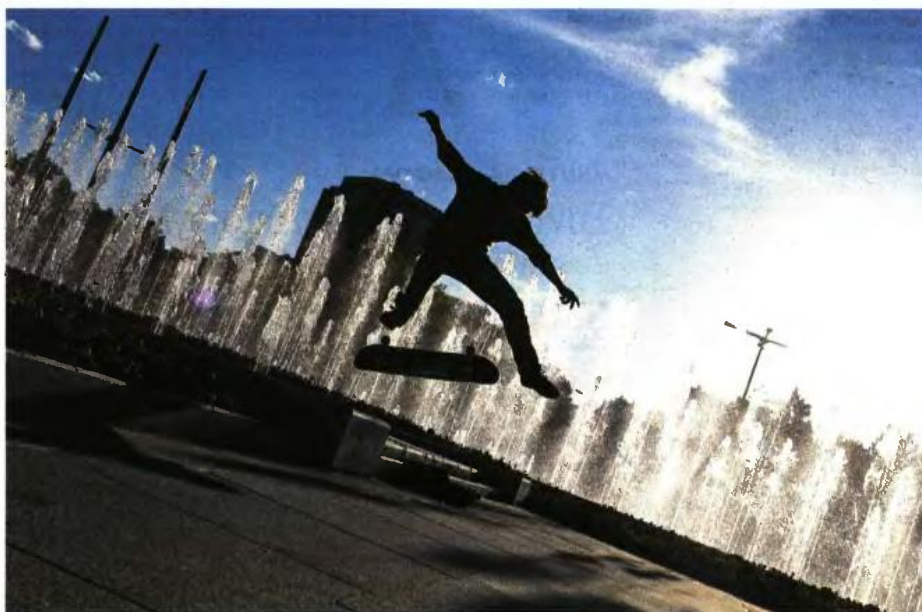
50067 / ΙΟΝΙΕΤΑΝΗΟΙ ΤΣΑΚΑΛΑΝΤΕ

ξαναγίνει ο κόσμος. Αρκεί βέβαια αυτοί οι δυο τύποι να μην έχουν χάσει εν τω μεταξύ την όρεξή τους για το μίλο, ή για την αμαρτία ή για τη γνώση. Πείτε το όπως θέλετε αλλά όταν θα τελειώσει αυτός ο πόλεμος δεν θα είναι η οικονομία ή οι θεσμοί που θα χρειαστούν άμεση ανοικοδόμηση. Θα είναι η σεξουαλική υγεία των νέων ανθρώπων. Αν υποθέσουμε ότι ο διαχωρισμός του νέου από τον γέρο θα ισχύει ακόμη, πράγμα για το οποίο ζωπρά αμφιβάλλω.