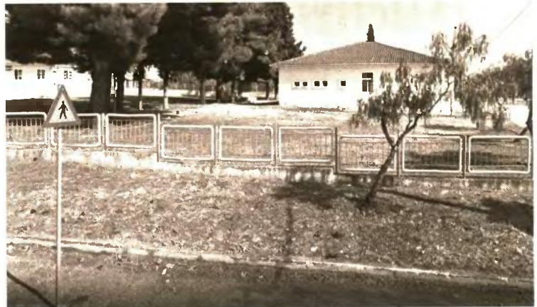
Μειώθηκε κατά 15% ο αριθμός των μαθητών την τελευταία πενταετία

Πέραν της υπογεννητικότητας, τα σχολεία ερημώνουν και από την επιλογή γονέων να φύγουν από τα χωριά τους και να πάνε προς κεντρικότερες περιοχές προκειμένου να έχουν τα παιδιά τους καλύτερη ευκαιρία στην εκπαίδευση. «Οι ποσοθε-