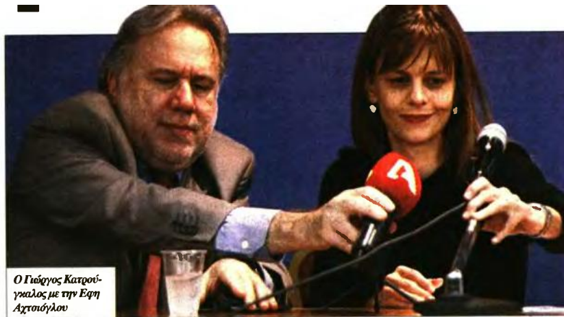
Ο Γιώργος Κατρούγκαλος με την Εφη Αχτσιόγλου

Ιανουαρίου 2023 θα συμψηφίζεται κατ'έτος με τις ετήσιες αναπροσαρμογές των συντάξεων έως την πλήρη εξάλειψή της. Αυτό σημαίνει ότι οι «παλιοί» συνταξιούχοι θα πρέπει να περιμένουν για περισσότερο-ενδεχομένως πολύ περισσότερο- από πέντε έτη μέχρι να ξαναδούν έστω μικρή αύξηση των συντάξεών τους. Στο πλαίσιο αυτό, αναφέρει ο κ.