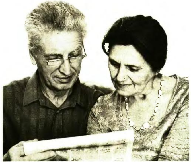
Τα ποσά που βγαίνουν εκτός σύνταξης για 250.000 παλαιούς συνταξιούχους του ΤΕΒΕ μετά τον επανυπολογισμό των αποδοκών τους

Συνταξιούχος με 30 χρόνια ΤΕΒΕ βγήκε με αρχικό ποσό 1.271,35 ευρώ. Σήμερα παίρνει 1.121,58 ευρώ πριν το φόρο. Με τον επανυπολογισμό, η νέα σύνταξη βγαίνει στα 663,49 ευρώ προ φόρου, δηλαδή μικρότερη κατά 458,09 ευρώ. Αυτό το ποσό βγαίνει εκτός σύνταξης και θα δίνεται ως προσωπική διαφορά. ■