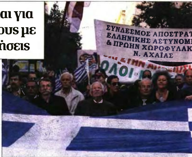
Από συγκέντρωση απόστρατων στην Αθήνα

ασφαλιστικές και οι λοιπές κρατήσεις θα γίνουν σύμφωνα με τη νομοθεσία που ίσχυε την περίοδο 2012-2016. Τα ποσά των αναδρομικών θα αποτυπωθούν σε ξεχωριστή μισθολογική κατάσταση. Ως χρόνος κτήσης θα θεωρηθεί το έτος 2018, παρότι επί της ουσίας ανατρέχουν σε προηγούμενα χρόνια. Το υπουργείο Οικονομικών ανακοίνωσε ότι θα προωθήσει στη Βουλή νομοθετική ρύθμιση, με την οποία θα προβλέπεται ότι η φορολογική υποχρέωση των δικαιούχων των αναδρομικών θα εξαντληθεί με την παρακράτηση του φόρου εισοδήματος, η οποία θα υπολογιστεί και θα διενεργηθεί με συντελεστή 20%.