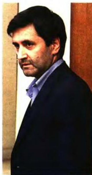
Ο αναπληρωτής υπουργός Οικονομικών Γιώργος Χουλιαράκης θα στείλει τη Δευτέρα στις Βρυξέλλες το σχέδιο του προϋπολογισμού του 2019 υποβάλλοντας το αίτημα να ακυρωθεί το μέτρο της περικοπής των παλαιών συντάξεων

2 Τις συζητήσεις που θα γίνουν με τους θεσμούς και τον επικεφαλής