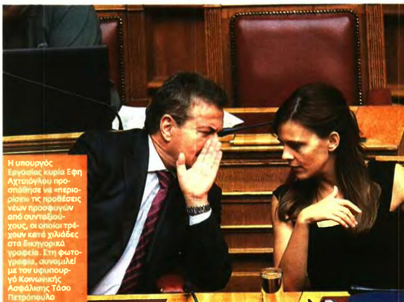
Η υπουργός Εργασίας κυρία Εφη Αχτσιόγλου προσπάθησε να «περιορίσει» τις προθέσεις νέων προσφύγων από συνταξιούχους, οι οποίοι τρέχουν κατά χιλιάδες στα διοικητικά γραφεία. Στη φωτογραφία, συνομιλεί με τον υφυπουργό Κοινωνικής Ασφάλισης Τάσο Πετρόπουλο