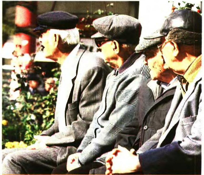
ΓΙΑΤΙ ΕΙΝΑΙ ΣΤΟΝ... ΑΕΡΑ Ο ΕΠΑΝΑΓΥΠΟΛΟΓΙΣΜΟΣ ΤΩΝ ΣΥΝΤΑΞΕΩΝ

Στην Ευρωπαϊκή Ένωση βλέπουν ότι λόγω ευρωεκλογών έχει ήδη ξεκινήσει μια παροχολογία, η υλοποίηση της οποίας μπορεί να θέσει σε κίνδυνο τους δημοσιονομικούς στόχους