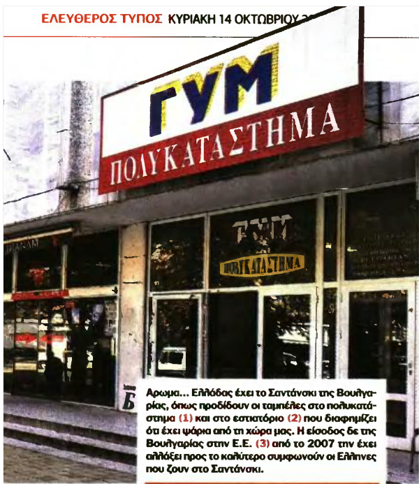
Αρωμα... Ελλήδες έχει το Σαντάνσκι της Βουλγαρίας, όπως προδίδουν οι ταμπέλες στο πολυκατάστημα (1) και στο εστιατόριο (2) που διαφημίζει ότι έχει ψάρια από τη χώρα μας. Η είσοδος δε της Βουλγαρίας στην Ε.Ε. (3) από το 2007 την έχει απλάξει προς το καλύτερο συμφωνούν οι Ελληνες που ζουν στο Σαντάνσκι.