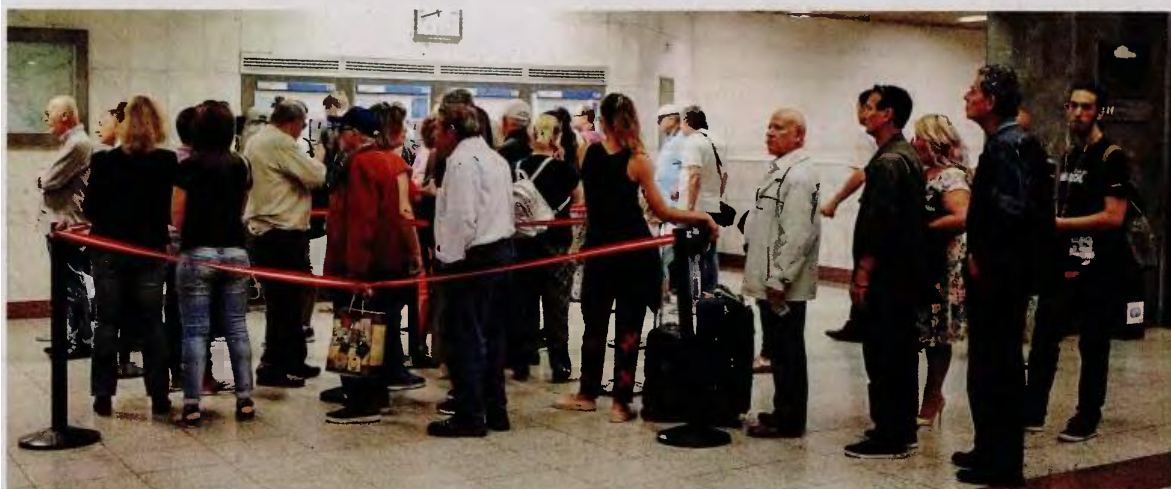
Τα γκισέ στους περισσότερους σταθμούς του μετρό είναι κλειστά, με αποτέλεσμα στα λίγα που λειτουργούν να δημιουργούνται ουρές.

Πρόσθετο πρόβλημα προκαλεί η απόφαση για διάθεση μειωμένων εισιτηρίων μόνο μέσω της χρήσης προσωποποιημένης κάρτας. Μέχρι πρότινος δεν ήταν εφικτή η προμήθειά τους από αυτόματο μηχανήματα αλλά μόνο από εκδοτήρια σταθμών. Πλέον για να προμηθευτεί κανείς μειωμένο εισιτήριο (ΑμεΑ, παιδιά, φοιτητές, πολύτεκνοι κ.α.) πρέπει να διαθέτει προσωποποιημένη κάρτα απεριορίστων διαδρομών, την οποία θα «φορτίζει» με μειωμένα εισιτήρια. Αυτό προκαλεί αντιδράσεις, καθώς υπάρχουν κατηγορίες πολιτών όπως π.χ. τα μικρά παιδιά ή οι επισκέπτες της πόλης (δικαιούχοι μειωμένου εισιτηρίου) που δεν αποτελούν συστηματικούς χρήστες, δεν διαθέτουν προσωποποιημένη κάρτα και δεν έχουν πλέον τρόπο να προμηθευτούν τα εισιτήρια μειωμένης αξίας που δικαιούνται. Σύμφωνα με τα τελευταία στοιχεία, έχουν εκδοθεί 88.000 προσωποποιημένες κάρτες σε άτομα άνω των 65 ετών, 101.000 σε φοιτητές και 7.000 σε πολύτεκνους.