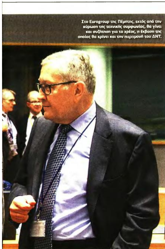
Στο Eurogroup της Πέμπτης, εκτός από την κύρωση της τεχνικής συμφωνίας, θα γίνει και συζήτηση για το χρέος, η έκβαση της οποίας θα κρίνει και την παραμονή του ΔΝΤ.