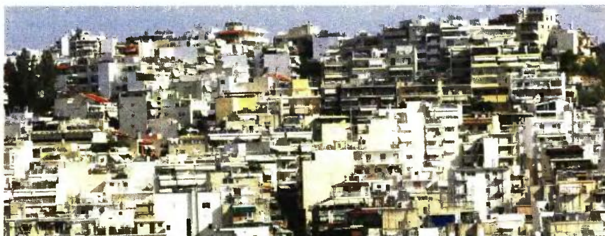
Σοβαρή επιβάρυνση από φόρους θα υποστούν οι ιδιοκτήτες ακινήτων σε «φθηνές» περιοχές με μεσαίο και χαμηλό εισόδημα.