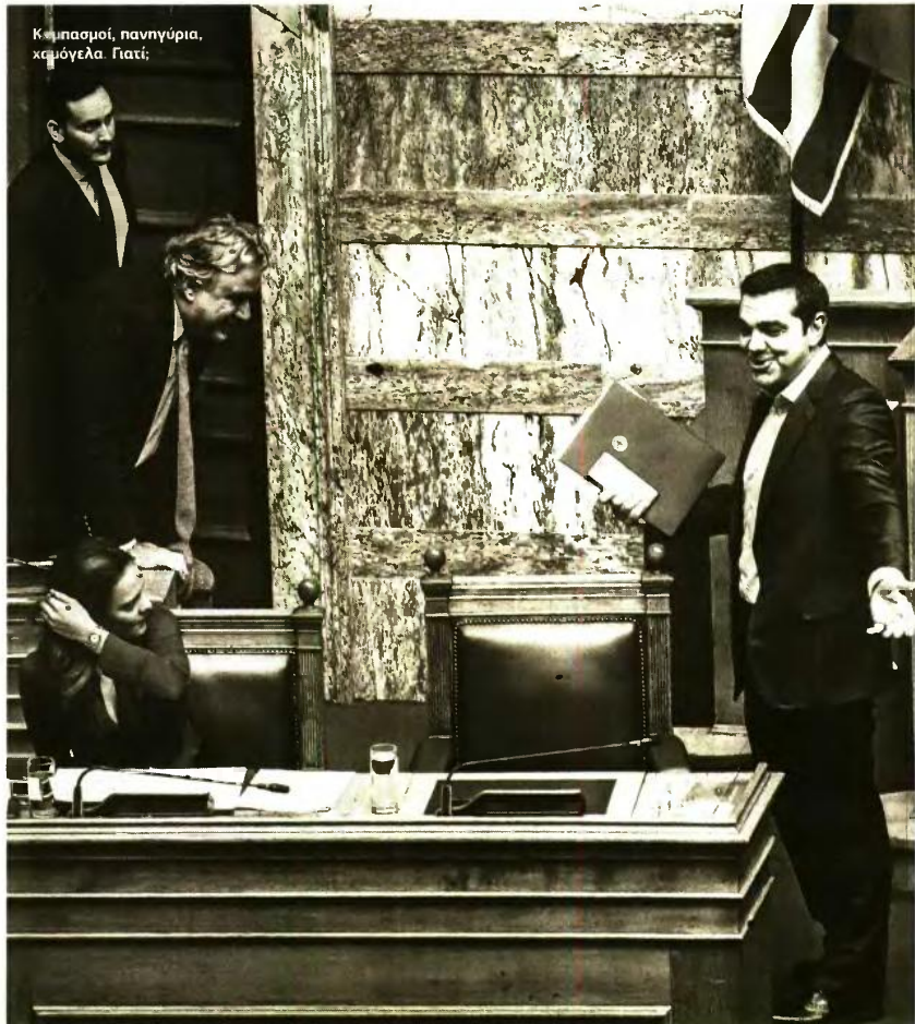
Καμπασοί, πανηγύρια, χαμόγελα. Γιατί: