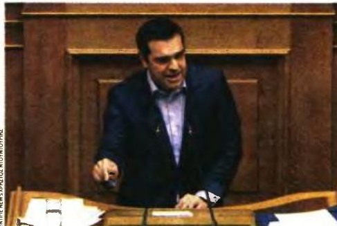
Ο πρωθυπουργός Αλέξης Τσίπρας, χτες, στο βήμα της Βουλής.

Ο κ. Τσίπρας έδωσε, όμως, και το έναυσμα για την μετατόπιση της αντιπαράθεσης ΣΥΡΙΖΑ-Ν.Δ. από τις περιοριστικές πολιτικές του παρελθόντος στο αν τα μέτρα είναι προεκλογικό χαρακτηρισμό ή ανεπαρκή. «Γυαίνουμε από τα μνημόνια, διασώσαμε τις συντάξεις, αποκαθιστούμε τις αδικίες, μειώνουμε τις ασφαλιστικές εισφορές, θα ξαναδώσουμε το κοινωνικό μέρισμα όπου υπάρχει πραγματικά αγ-