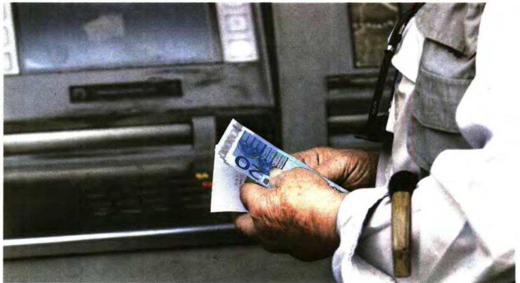
Ο επανυπολογισμός βγάζει από το τραπέζι τις αντισυνταγματικές περικοπές και δημιουργεί νέο ποσό σύνταξης