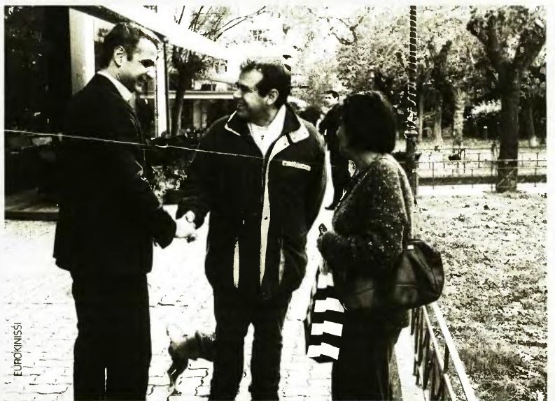
Από την επίσκεψη του Κυριάκου Μητσοτάκη στην Κυψέλη.

Σε αυτή τη λογική και υπηρέτωντας το προεκλογικό σχέδιο, ο κ. Τσίπρας επέλεξε να μην κάνει καμία αναφορά στην πραγματική κατάσταση της οικονομίας. Στην αρνητική στάση των αγορών, στην αδυναμία να προσεγγίσουμε τις αγορές, στις κίτρινες κάρτες για το τέλος στις μεταρρυθμίσεις που συνεχίζονται και στη μεταμνημονιακή φάση, στην πλασματική μείωση της ανεργίας με την επικράτηση επισφαλών part time θέσεων εργασίας, στις αναφαλαίσιμες προβλέψεις για ισχυρή ανάπτυξη, στις αβάσιμες προβλέψεις για τις ιδιωτικές επενδύσεις που έπρεσαν εντελώς εκτός για το 2018, στην περικοπή του Προγράμματος Δημοσίων Επενδύσεων, στη μείωση των μισθών στον ιδιωτικό τομέα κ.λπ. ■