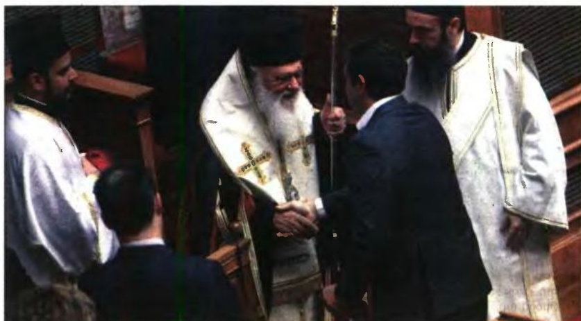
Ο πρωθυπουργός Αλέξης Τσίπρας με τον Αρχιεπίσκοπο Ιερώνυμο κατά τον αγιασμό για την έναρξη της νέας κοινοβουλευτικής περιόδου

Επίσης η ερμηνευτική δήλωση για το ότι ο ορος επικρατούσα