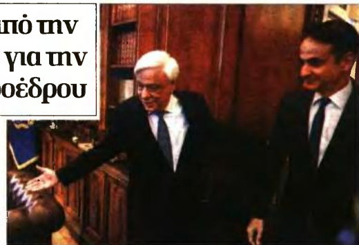
Ο Πρόεδρος της Δημοκρατίας Πρ. Παυλόπουλος με τον αρχηγό της Ν.Δ. Κιμάκο Μητσοτάκη

Αντίθετο είναι και το ΚΙΝ.ΑΛ., με συνεργάτες της Φώφης Γεννηματά να επισομαίνουν τη ριζική διαφωνία τους να οδ-