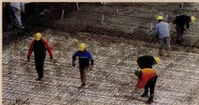
Η όποια απόφαση για αύξηση του κατώτατου μισθού θα ισχύσει από τον Ιανουάριο του 2019.

να αποσταλούν στο Κέντρο Προγραμματισμού και Οικονομικών Ερευνών (ΚΕΠΙΕ), προκειμένου να συνταχθεί το τελικό σχέδιο πορίσματος διαβούλευσης, σε συνεργασία με την αρμόδια επιτροπή που προΐσταται της διαδικασίας. Το σχέδιο πορίσματος διαβούλευσης, που μπορεί να αποκλίνει ή και να διαφοροποιείται από τις εκθέσεις, θα κατατεθεί τον Δεκέμβριο. Η τελική απόφαση της υπουργού Εργασίας, κατόπιν έγκρισης του υπουργικού συμβουλίου, θα υπογραφεί τον Ιανουάριο του 2019. Σύμφωνα δε με την κ. Αχτσιόγλου, παράλληλα θα καταργηθεί και ο υποκατώτατος μισθός, ώστε ο νέος αυξημένος κατώτατος να ισχύει χωρίς δυσμενείς ηλικιακές διακρίσεις.