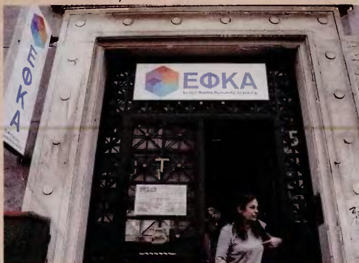
Οι αιτήσεις διαγραφής παλαιών οφειλών θα γίνονται ηλεκτρονικά, μέσω ειδικής πλατφόρμας στον ΕΦΚΑ, που αναμένεται να τεθεί σε λειτουργία εντός των επόμενων ολίγων ημερών.

1. Όσους υπήχθησαν στην ασφάλιση του πρώην ΟΑΕΕ και του πρώην ΟΓΑ, λόγω δραστηριοποίησης σε περιοχές με ειδικά