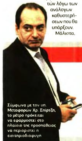
Σύμφωνα με τον υπ. Μεταφορών Χρ. Σπύρτζη, το μέτρο πρόκειται να εφαρμοστεί στο πλαίσιο της προσπάθειας να περιοριστεί η εισιτηριοδιαφυγή