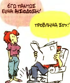
ΤΟΥ ΚΩΣΤΑ ΣΚΑΛΑΒΕΝΙΤΗ

Βροχή οι κατασχέσεις τραπεζικών λογαριασμών, περιουσιακών στοιχείων και οι ηλεκτρονικοί πλειστηριασμοί από δήμους