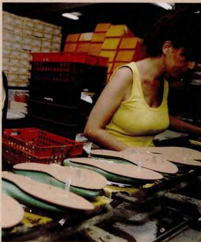
Η εγκύκλιος του υπ. Εργασίας καθορίζει τις προϋποθέσεις επέκτασης των κλαδικών συμβάσεων εργασίας από τον Αύγουστο του 2018 και μετά.

2. Η συλλογική σύμβαση εργασίας κατατίθεται στο Τμήμα Συλλογικών Συμβάσεων και Συλλογικής Οργάνωσης του υπουργείου Εργασίας και γνωστοποιείται η Στατιστική Ταξινόμηση των Κλάδων Οικονομικής Δραστηριότητας