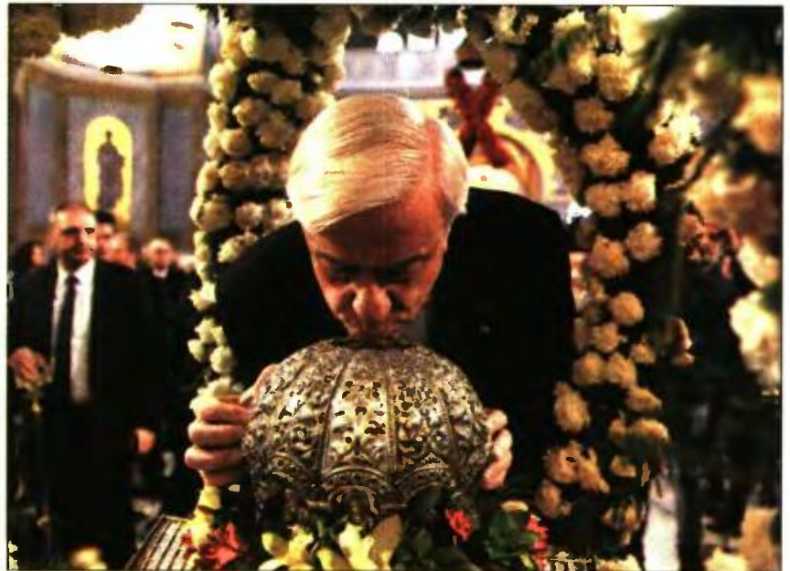
Ο Πρόεδρος της Δημοκρατίας Προκόπης Παυλόπουλος προσκυνά την τιμία κάρα του Αποστόλου Ανδρέα κατά τη διάρκεια των χριστιανικών εορτασμών στην Πάτρα

στα διδάγματα του πρωτοκλήτου Αποστόλου Ανδρέου. Και οφείλω να καταθέσω εδώ και τούτο, το οποίο νομίζω έχει μεγαλύτερη σημασία όταν εκπορεύεται από τον Πρόεδρο της Δημοκρατίας: ότι όλοι οφείλουμε να αναγνωρί-