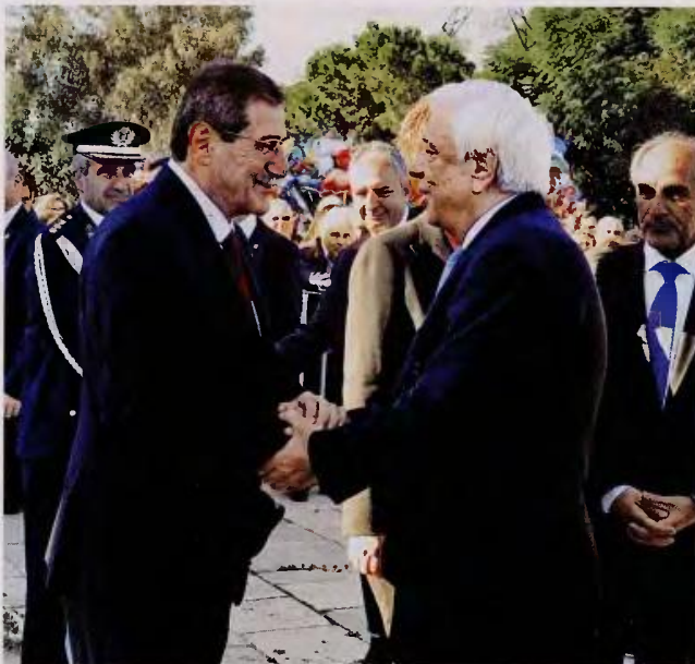
ΑΠΕ-ΜΠΕ / ΓΙΩΤΑ ΚΟΡΜΠΑΡΗ

Πηγές της Προεδρίας έλεγαν ότι στην τοποθέτησή του ο κ. Παυλόπουλος απλώς θύμισε μια ιστορική πραγματικότητα που ισχύει από συστάσεως του ελληνικού κράτους και δη τις διατάξεις που αποτυπώνουν την ιστορική πραγματικότητα ότι η επικρατούσα θρησκεία στην Ελλάδα είναι η χριστιανική ορθόδοξη (σ.σ. γι' αυτό και η επισημάνση ότι δεν θεσπίζουν το «δέον», αλλά την πραγματικότητα).