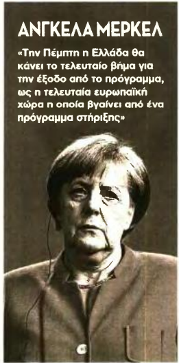
ΑΝΓΚΕΛΑ ΜΕΡΚΕΛ «Την Πέμπτη η Ελλάδα θα κάνει το τελευταίο βήμα για την έξοδο από το πρόγραμμα, ως η τελευταία ευρωπαϊκή χώρα η οποία βγαίνει από ένα πρόγραμμα στήριξης»

ΕΚΚΡΕΜΟΤΗΤΕΣ. Ευρωπαίος αξιωματούχος, αναφερόμενος χθες από τις Βρυξέλλες στις εκκρεμότητες που έχει να αντιμετωπίσει η Ελλάδα, υπογράμμισε τη στελέκωση της Ανεξάρτητης Αρχής Δημοσίων Εσόδων, την ενσωμάτωση όλων των Ταμείων στον ΕΦΚΑ, την υλοποίηση του νέου συστήματος κοινωνικών επιδομάτων, την αποπληρωμή των ληξιπρόθεσμων οφελών στον ιδιωτικό τομέα και την αποφυγή δημιουργίας νέων. Μεταξύ των διαρθρωτικών μεταρρυθμίσεων που θα πρέπει να υλοποιηθούν μετά τη λήξη του προγράμματος, ο ευρωπαίος αξιωματούχος αναφέρθηκε, τέλος, στην ολοκλήρωση του Εθνικού Κτηματολογίου έως το 2021, στο άνοιγμα της αγοράς ενέργειας εντός του 2019, καθώς και σε μια σειρά αποκρατικοποιήσεων. Όσον αφορά τον κατώτατο μισθό, πληροφορίες αναφέρουν πως η ελληνική κυβέρνηση θα δεσμευθεί σε «μετρημένες» αυξήσεις τα επόμενα χρόνια, στα όρια αντοχής της οικονομίας και των εγκρίσεων των δανειστών.