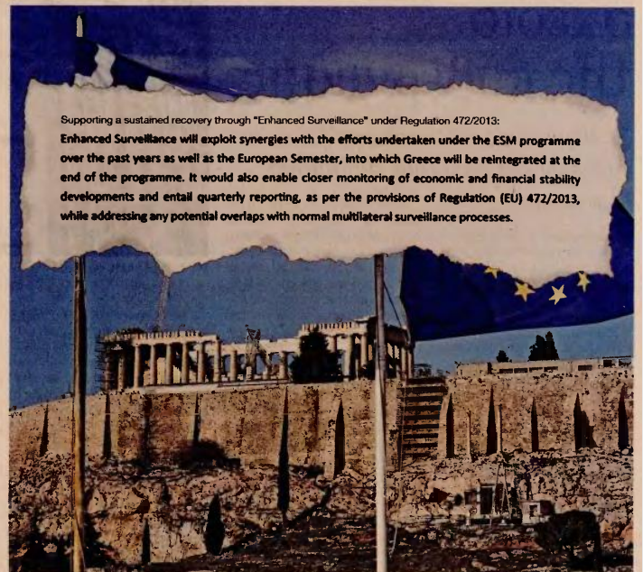
Supporting a sustained recovery through "Enhanced Surveillance" under Regulation 472/2013: Enhanced Surveillance will exploit synergies with the efforts undertaken under the ESM programme over the past years as well as the European Semester, into which Greece will be reintegrated at the end of the programme. It would also enable closer monitoring of economic and financial stability developments and entail quarterly reporting, as per the provisions of Regulation (EU) 472/2013, while addressing any potential overlaps with normal multilateral surveillance processes.

«Η Ελλάδα επιβεβαιώνει την πρόθεσή της να ολοκληρώσει τις συναλλαγές για την παραχώρηση του αεροδρομίου "Ελ. Βενιζέλος" και του ΔΕΣΦΑ (τέλος 2018), των ΕΛΠΕ (συμπεριλαμβανομένων της μεταφοράς υπολοίπων μετοχών στο HCAP) και της γαρίνας του Αλιφίου (μέσα 2019), της Γεννατίας, των ΕΥ-