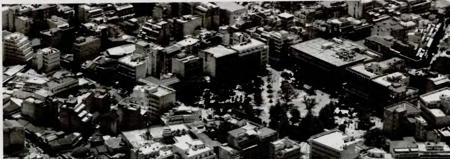
Του Γιάννου Νούϊν