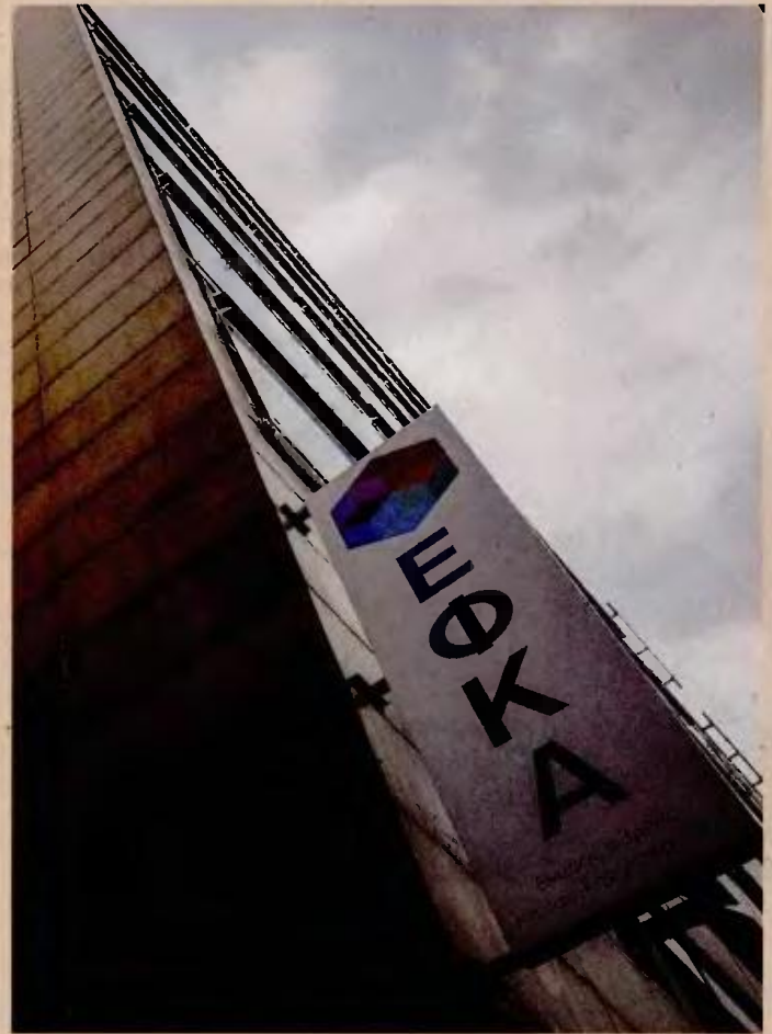
Η ρύθμιση θα δώσει ανάσα σε χιλιάδες ελεύθερους επαγγελματίες, μηχανικούς, γιατρούς, δικηγόρους, δημοσιογράφους, αλλά και σε αγρότες.

3. Για την επίλυση των ανωτέρω ασφαλιστικών αμφισβητήσεων εκδίδεται, για κάθε εξεταζόμενη κατηγορία ασφαλισμένων, απόφαση του υπουργού Εργασίας, Κοινωνικής Ασφάλισης και Κοινωνικής Αλληλεγγύης, ύστερα από σχετική γνωμοδότηση του Συμβουλίου Κοινωνικής Ασφάλισης, με την οποία καθορίζονται οι όροι