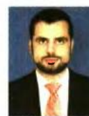
Επιμέλεια: ΔΙΟΝΥΣΗΣ ΡΙΖΟΣ Δικηγόρος, ειδικός σε θέματα κοινωνικής ασφάλισης