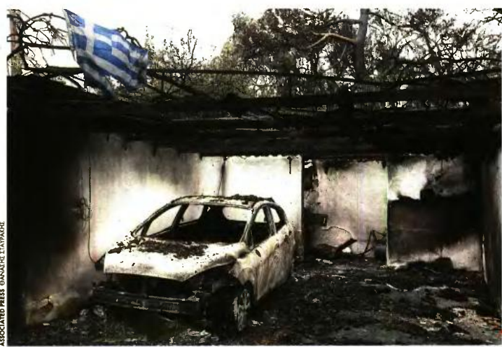
ASSOCIATED PRESS ΘΑΝΑΣΗΣ ΣΤΑΥΡΗΣ

Οι τράπεζες αναμένεται να ανακοινώσουν περαιτέρω οικονομική συνδρομή για την ανασυγκρότηση κρίσιμων κοινωνικών υποδομών των πληγισμένων περιοχών (σχολεία, γηροκομεία, πάρκα κ.λπ.) καθώς και την αποκατάσταση του φυσικού περιβάλλοντος της ευρύτερης περιοχής