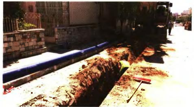
Το σταματημένο έργο της ύδρευσης έρχεται επί τάπητος στη σημερινή συνεδρίαση του διοικητικού συμβουλίου

Ωστόσο από τον εργολάβο κατατέθηκε στις 22 Νοεμβρίου ειδική δήλωση διακοπής των εργα-