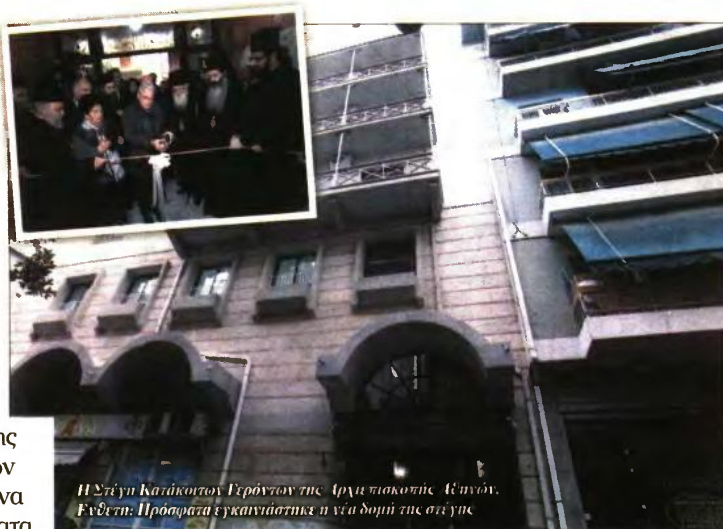
Η Στέγη Κατάκοιτων Γερόντων της Αρχιεπισκοπής Αθηνών. Ένδετη: Πρόσφατα εγκαινιάστηκε η νέα δομή της στέγης.

Ε γκαινιάστηκε πρόσφατα η νέα δομή της Στέγης Κατάκοιτων Γερόντων της Αρχιεπισκοπής στην περιοχή του Αγίου Παντελεήμονα, ένα όνειρο που ύστερα από πολλές δυσκολίες έγινε πραγματικότητα. Ενα κέντρο που προσφέρει στέγη, τροφή, θέρμανση, προστασία, περιποίηση, φροντίδα και πρωτοβάθμια νοσηλεία σε ηλικιωμένους κατάκοιτους, οι οποίοι αδυνατούν να φροντίσουν τον εαυτό τους. «Η δημιουργία της Στέγης Κατάκοιτων Γερόντων της Ιε-