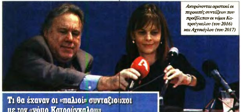
Ακυρώνονται οριστικά οι περικοπές συντάξεων που προβλέπαν οι νόμοι Κατρούγκαλου (του 2016) και Αχτσιόγλου (του 2017)

Επίσης, στους «κερδισμένους» συμπεριλαμβάνονται «νέοι» συνταξιούχοι, αρκετοί δηλαδή από τους 200.000 «απόμαχους» που συνταξιοδοτήθηκαν από τις 13 Μαΐου 2016 και μετά, και έχουν προσωπική διαφορά πάνω από 20% σε σχέση με το ποσό που θα λάμβαναν