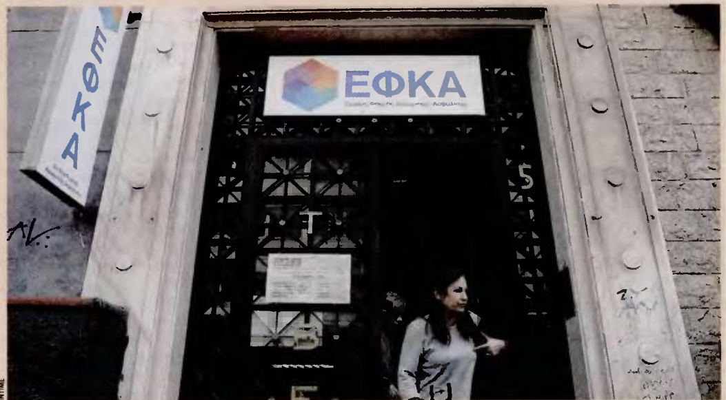
Η ετήσια δαπάνη που προκαλείται στους προϋπολογισμούς των ταμείων ΕΦΚΑ και ΕΤΕΑΕΠ ανέρχεται για το 2019 σε 2,960 δισ. ευρώ και πέφτει στα 2,707 δισ. ευρώ το 2022.