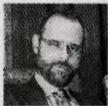
■ Του ΚΩΝΣΤΑΝΤΙΝΟΥ ΜΑΡΑΒΕΓΙΑ*

Ο ι τρίτεκνοι είναι στη σημερινή κατάσταση της Ελλάδας από τις πιο αδικημένες ομάδες. Έχουν τον δικό τους ανήφορο την ώρα που το κράτος τους γυρίζει την πλάτη δυσανάλογα σε σχέση με άλλες κατηγορίες πολιτών. Τα παιδιά είναι ανάγκη για τη χώρα και όχι είδος πολυτελείας για να χρησιμοποιούνται ως τεκμήριο διαβίωσης!