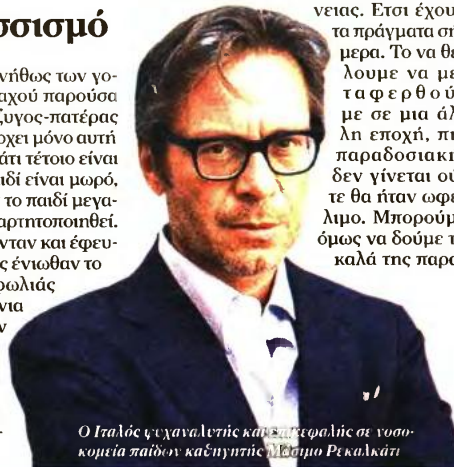
Ο Ιταλός ψυχολόγος και φιλοσοφός σε νοσοκομεία παιδών και ψυχιάτριο Massimo Recalcati

νονία μόνο αυτό της ζητούσε- ξεχνούσε ότι ήταν και σύζυγος, με ό,τι αυτό συνεπαγόταν για την ομαλή λειτουργία της συζύγιας και κατ' επέκταση της οικογένειας. Ετσι έχουν τα πράγματα σήμερα. Το να θέλουμε να μεταφερθούμε σε μια άλλη εποχή, πιο παραδοσιακή, δεν γίνεται ούτε θα ήταν ωφέλιμο. Μπορούμε όμως να δούμε τα καλά της παρα-