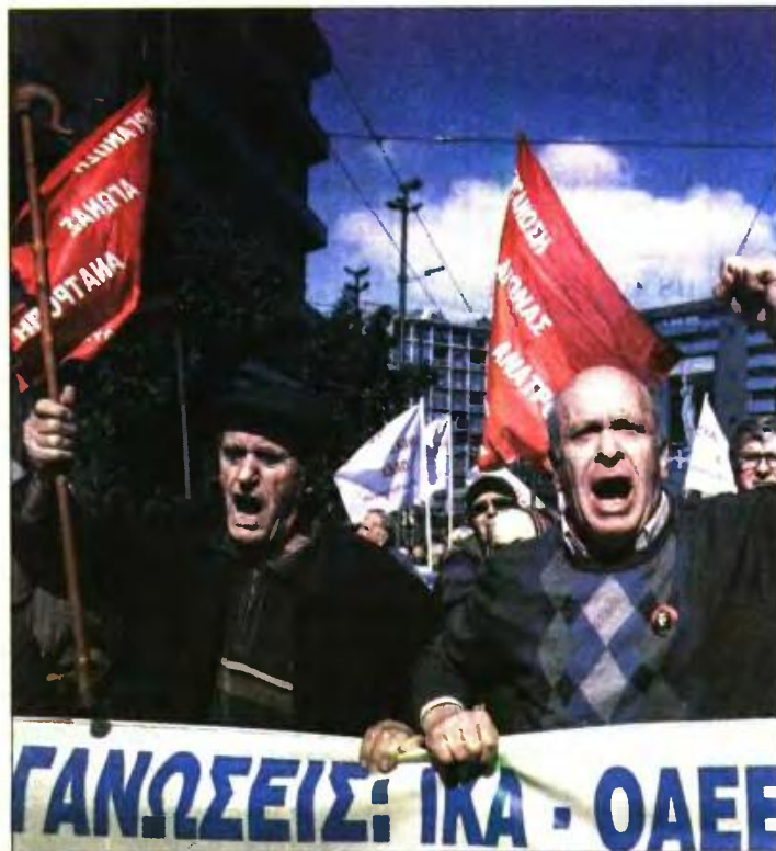
Από πρόσφατη κινητοποίηση των συνταξιούχων

Με το νέο σύστημα υπολογισμού των συντάξεων, υποστηρίζει το ΕΝΔΙΣΥ, «για 20 χρόνια υπηρεσίας και συντάξιμες αποδοχές 600 ευρώ ο συντελεστής αναπλήρωσης είναι κοντά στο 90%. Μειώνεται στο 57% για 30 χρόνια