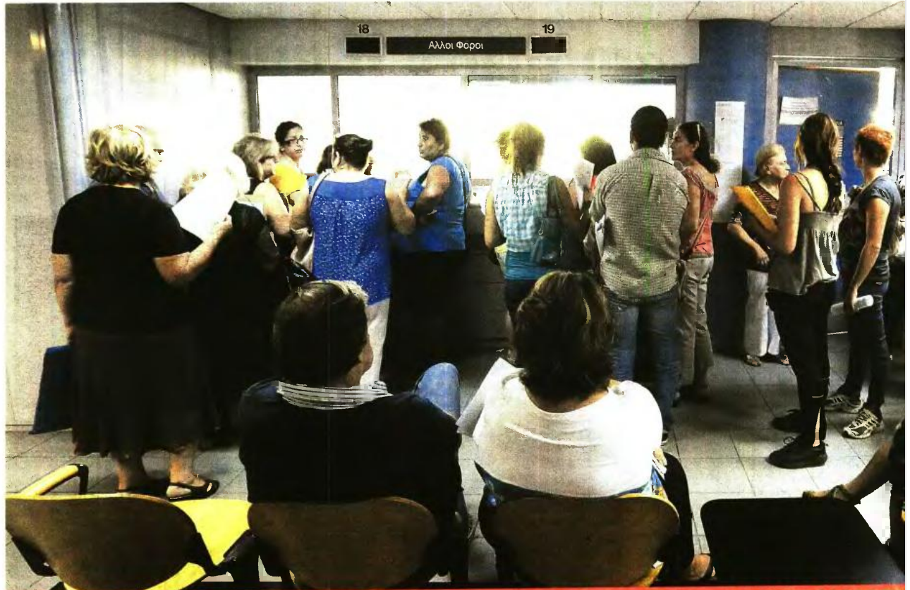
6 ΠΑΓΙΔΕΣ ΥΠΕΡΦΟΡΟΛΟΓΗΣΗΣ: ΒΑΣΕΙ ΤΩΝ ΤΕΚΜΗΡΙΩΝ ΔΙΑΒΙΩΣΗΣ, ΤΩΝ ΣΥΝΤΕΛΕΣΤΩΝ ΦΟΡΟΛΟΓΗΣΗΣ ΤΗΣ ΠΡΟΚΑΤΑΒΟΛΗΣ ΦΟΡΟΥ 100%, ΤΟΥ ΤΕΛΟΥΣ ΕΠΙΤΗΔΕΥΜΑΤΟΣ 650 ΕΥΡΩ, ΤΗΣ ΕΙΔΙΚΗΣ ΕΙΣΦΟΡΑΣ