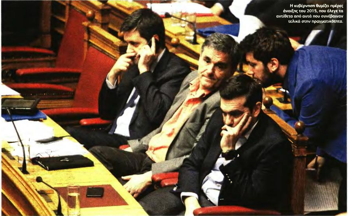
Η κυβέρνηση θυμίζει ημέρες άνοιξης του 2015, που έλεγε τα αντίθετα από αυτά που συνέβαιναν τελικά στην πραγματικότητα.

ΜΑΞΙΜΟΥ: ΥΠΟΣΧΕΣΕΙΣ ΣΤΟΥΣ ΠΟΛΙΤΕΣ ΓΙΑ ΣΥΝΤΑΞΕΙΣ, ΑΦΟΡΟΛΟΓΗΤΟ, ΔΕΣΜΕΥΣΕΙΣ ΤΗΡΗΣΗΣ ΣΤΟΥΣ ΘΕΣΜΟΥΣ