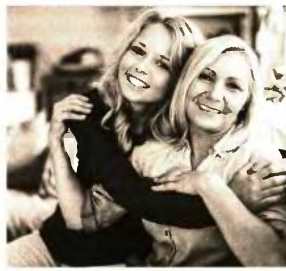
Εργαζόμενοι σε ΔΕΚΟ μπορούν να αποχωρήσουν με 35ετία, ενώ οι μητέρες με πλήρη στα 55 αν έχουν 5.500 ένησμα και ανήλικο το 2010

χύρωσαν μειωμένη στα 55 και πλήρη στα 60. Προσοχή, οι συγκεκριμένες κατηγορίες πρέπει να έχουν συμπληρώσει το αντίστοιχο όριο ηλικίας πριν από τον Αύγουστο του 2015.