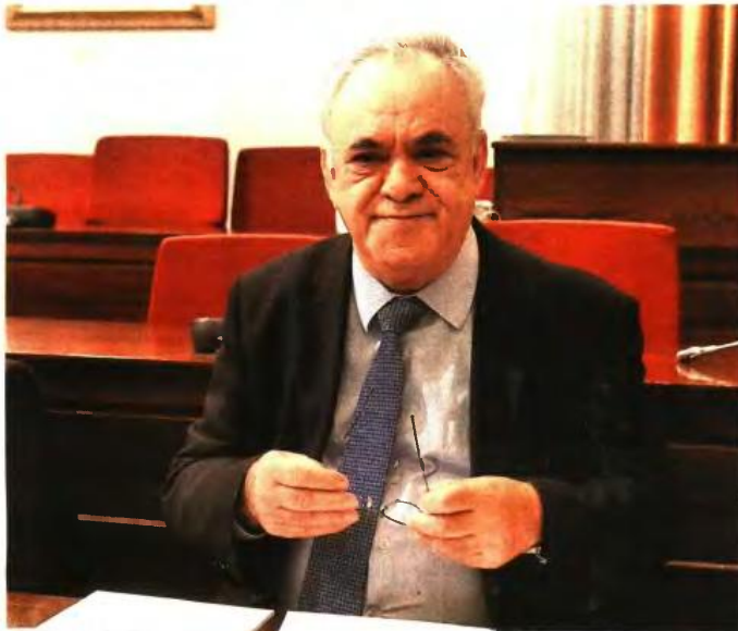
Η στεγαστική πολιτική έχει στόχο να καλύψει όλους τους πολίτες. Δηλαδή εκείνους που έχουν σπίτι με δάνειο το οποίο δεν μπορούν να εξυπηρετήσουν και εκείνους που δεν έχουν σπίτι, δεν έχουν δάνειο, αλλά έχουν πρόβλημα στέγης, τονίζει ο Γ. Δραγασάκης