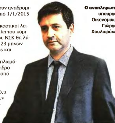
Ο αναπληρωτής υπουργός Οικονομικών Γιώργος Χουλιαράκης

ερευνητές θα λάβουν αναδρομικά 16,5 μηνών (από 1/1/2015 έως 12/5/2016). ■ Συνταξιούχοι δικαστικοί λειτουργοί και πρ. μέλη του κύριου προσωπικού του ΝΣΚ θα λάβουν αναδρομικά 23 μηνών (από 1/8/2012 έως και 30/6/2014). ■ Συνταξιούχοι διπλωμάτες θα λάβουν αναδρομικά 16,5 μηνών (από 1/1/2015 έως 12/5/2016). Σε αντιστοιχία με ό,τι συμβαίνει με τους εν ενεργεία υπαλλήλους, αν οι συνταξιούχοι έχουν λάβει, σε εκτέ-