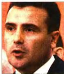
Ο Ζόραν Ζάεφ

θέση εξάρτησης και υποταγής από μια χώρα και εν προκειμένω την Ελλάδα, και, σύμφωνα με τον ποινικό κώδικα, «όποιος πολίτης οδηγεί τη χώρα σε αυτή τη θέση θα πρέπει να καταδικαστεί σε φυλάκιση πέντε ετών». Αυτό σημαίνει πως το νομοσχέδιο κύρωσης της συμφωνίας επιστρέφει στο σκοπιανό Κοινοβούλιο, το οποίο θα πρέπει να το ψηφίσει με απόλυτη πλειοψηφία (61 βουλευτές).