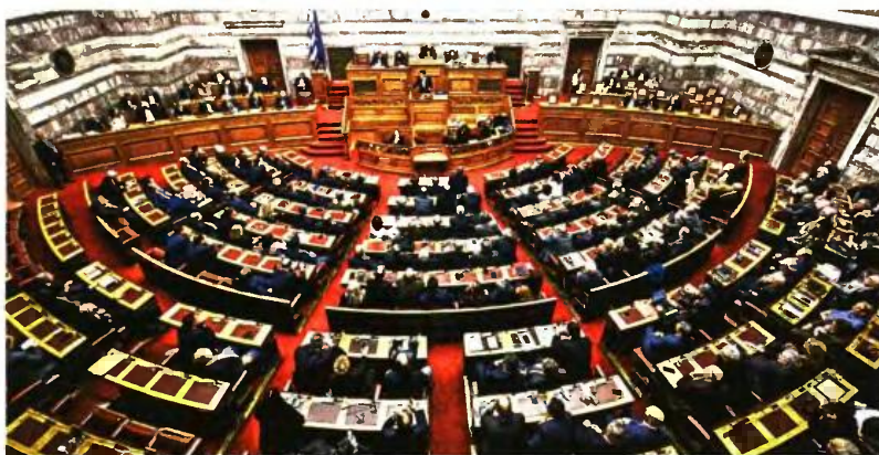
ΕΥΡΟΚΙΝΗΣΗ / ΚΟΝΤΑΡΙΝΗΣ ΠΑΡΤΟΣ