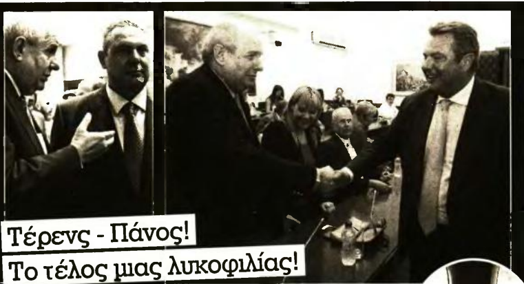
Τέρενς - Πάνος! Το τέλος μας λυκοφιλίας!

ΓΙΑ ΝΑ ΜΗΝ υπάρχει έκπληξη. Στο πρόγραμμα του ΣΥΡΙΖΑ το 2014 υπήρχε σαφής αναφορά για την ανασεώρηση Συντάγματος και την απαλοιφή κάθε θρησκευτικού στοιχείου, όσον αφορά τη σύνδεση της Ελλάδας με την Ορθοδοξία. Επίσης, υπάρχει σαφής αναφορά για αφαίρεση άρθρων, όπως το περίφημο άρθρο 120, για ανασεώρηση εκλογικών διατάξεων (μετά το Σύνταγμα), για ανασεώρηση άρθρων που φέρουν σύνδεση με ειδικές αναφορές για το Ελληνικό Γένος, όπως και εστίαση στο θέμα της αναφοράς σε οικογένεια, δίνοντας χώρο για ερμηνείες.