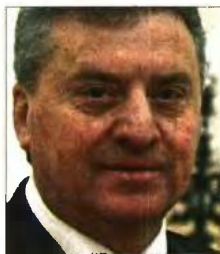
Ο Γκεόργκι Ιβανόφ

«Δεν δέχομαι ιδέες ή προτάσεις που θα μπορούσαν να βάλουν σε κίνδυνο την εθνική ταυτότητα των "Μακεδόνων", την ιδιομορφία του "μακεδονικού" έθνους και της "μακεδονικής" γλώσσας» είπε, μεταξύ άλλων, ο κ. Ιβανόφ, προσθέτοντας πως «η συμφωνία φέρνει τη "Δημοκρατία της Μακεδονίας" σε