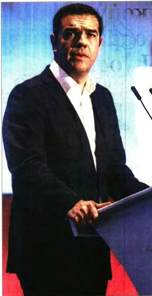
Ο Αλέξης Τσίπρας εξαγγέλλει τα μέτρα από το βήμα της ΔΕΘ

• Η εξαγγελθείσα μείωση της εισφοράς κύριας ασφάλισης (από 20% σε 13,3%) θα ισχύσει μόνο για όσους δήλωσαν εισόδημα πάνω από 7.032 ευρώ ετησίως ή πάνω από 586 ευρώ τον μήνα και όχι για όσους θα δήλωσουν κάτω από 7.032 ευρώ ετησίως. Ετσι, από τη μείωση την οποία εξήγησε ο κ. Τσίπρας αποκλείονται περίπου στους 3 στους 4 ελεύθερους επαγγελματίες, οι οποίοι -σύμφωνα με τα στοιχεία της ίδιας της κυβέρνησης- δηλώνουν στην Εφορία εισόδημα έως 7.032 ευρώ. Υπενθυμίζεται, όμως, ότι η κυβέρνηση έχει αποδεχθεί ρητά έναντι των θεσμών την κατάργηση της έκπτωσης 15% στη βάση υπολογισμού όλων των εισφορών από την 1η Ιανουαρίου 2019. Μάλιστα, από την 1η Ιανουαρίου 2018, οι εισφορές των επαγγελματιών υπολογίζονται επί του 85% του αθροίσματος του καθαρού δηλωτέου εισοδήματος του 2016 και