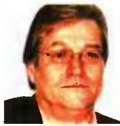
ΓΡΑΦΕΙ Ο ΑΝΤΩΝΗΣ ΚΟΚΟΡΙΚΟΣ