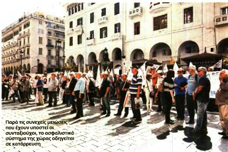
Παρά τις συνεχείς μειώσεις που έχουν υποστεί οι συντάξιούχοι, το ασφαλιστικό σύστημα της χώρας οδηγείται σε κατάρρευση