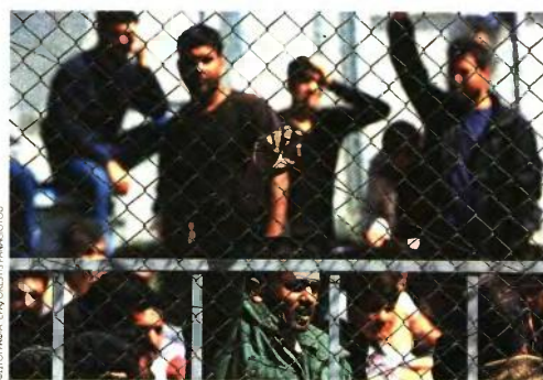
Στις συνθήκες που επικρατούν στη Μόρια και σε άλλες υποδομές ευδοκίμων η στρατολόγηση και ο προσληπτικός σε εξτρεμιστικές και μισαλλόδοξες απόψεις

Ο κ. Κωνσταντίνος Φίλις είναι διευθυντής Ερευνών του Ινστιτούτου Διεθνών Σχέσεων.